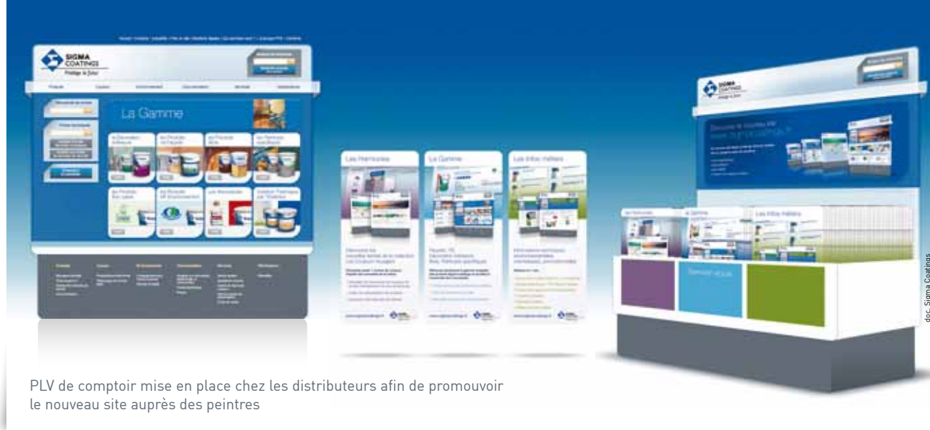
PLV de comptoir mise en place chez les distributeurs afin de promouvoir le nouveau site auprès des peintres