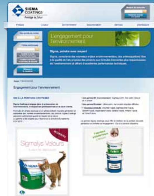
doc. Sigma Coatings

Confirmant son engagement pour l'environnement, Sigma Coatings offre une mine d'informations relatives à l'innovation et au conseil pour accompagner les internautes dans leurs démarches éco-responsables.