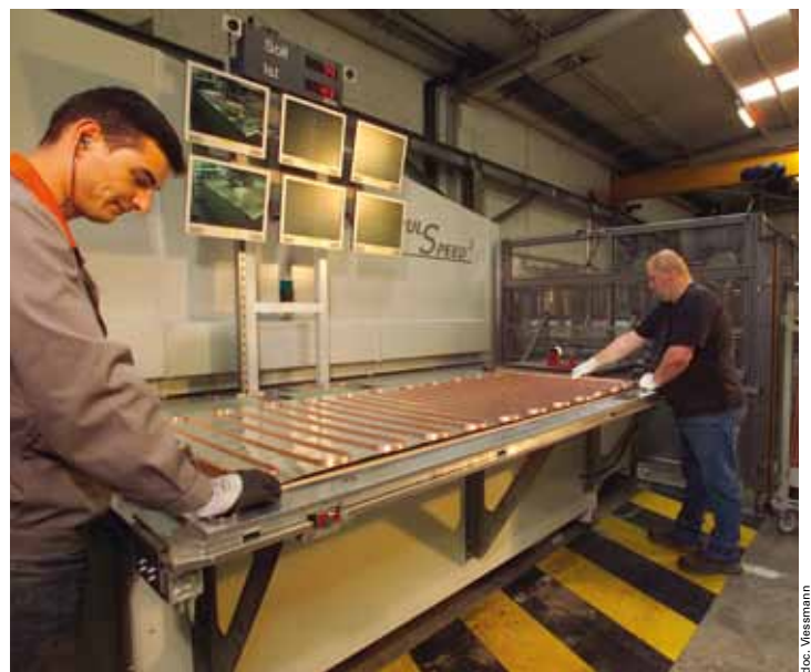
Gros plan sur la fabrication d'un capteur solaire thermique plan dont Viessmann constitue le leader français.

Le centre logistique Viessmann est l'un des seuls en Europe à être entièrement piloté par la technologie RFID associée à un ERP. Cette technologie utilise la radiofréquence pour identifier les produits équipés d'une puce, pour les déclarer et les expédier, en temps réel, sans aucune intervention humaine.