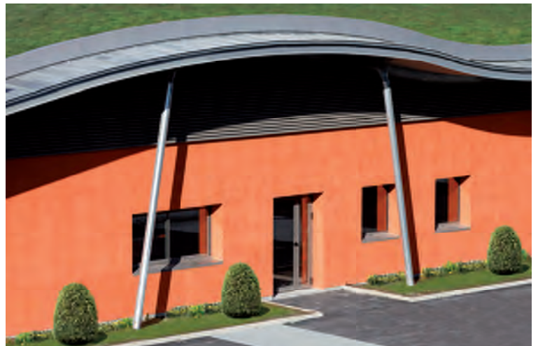
Lycée La Fourragère à Marseille, réalisé avec la teinte Orange Terracotta (931) offrant modernité et originalité à ce lieu de vie.

Ces références permettent de composer les façades en harmonie avec des matériaux très contemporains (produits de synthèse, métaux, verre...) ou traditionnels (bois, béton, façades végétales...).