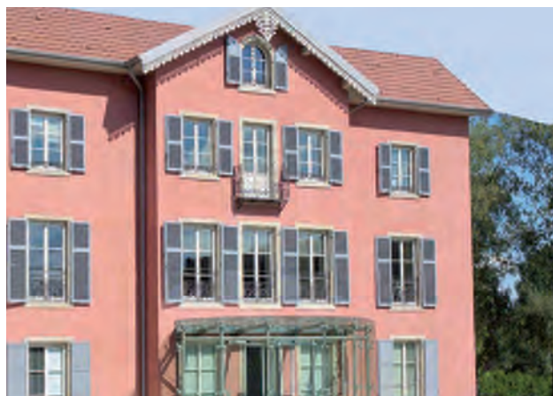
Rénovation du bâtiment du Conseil Général du Doubs avec le weber. unicor ST (enduit mince taloché à la chaux aérienne), enduit sélectionné pour sa capacité à retranscrire les teintes et matières de la façade d'origine.

Des outils synthétiques et d'un format pratique, faciles à utiliser sur le chantier ou lors de rendez-vous clients , véritable aide à la décision et support de vente, pour les prescripteurs, négociants et professionnels du bâtiment.