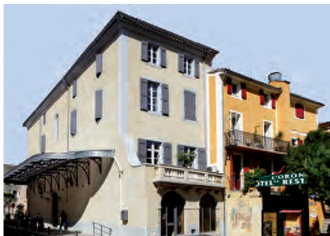
Architecte : Atelier GOASMAT Architecture

Conditionnés en sacs, applicables manuellement ou par projection, ces enduits minéraux minces ou épais répondent à l'ensemble des chantiers de façades, en neuf comme en rénovation ainsi qu'en finition et décoration de systèmes d'I.T.E.