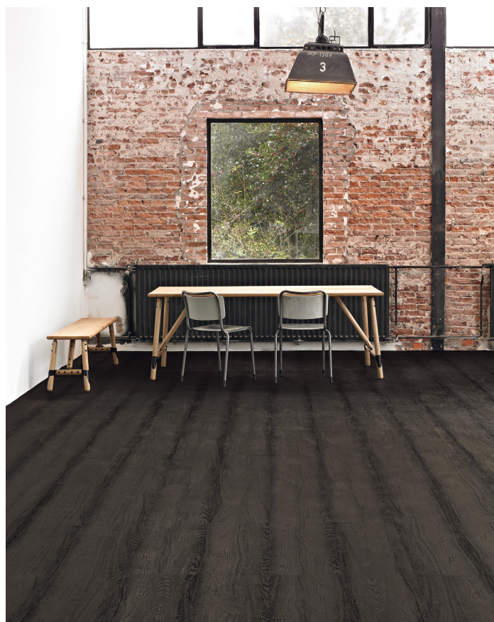
De nombreux revêtements de sol souples signés Forbo Flooring Systems sont désormais produits sans phtalate. Parmi eux, la nouvelle collection LVT (Luxury Vinyl Tiles) Allura. Ci-dessus, Allura Premium, une gamme signature inspirée de l'effet bois, propose un sol sain et de caractère au décor exclusif fascinant.

Avec cette nouvelle génération de revêtements de sol souples, Forbo Flooring Systems couvre l'ensemble des segments du marché : la santé, l'enseignement, l'hôtellerie et les loisirs, le résidentiel, les bureaux, l'industrie . Forbo Flooring Systems met ses standards environnementaux élevés, gages de bien-être et de qualité de vie, au service de tous les publics et de tous les locaux – une véritable révolution en matière de performance, d'écologie et de santé.