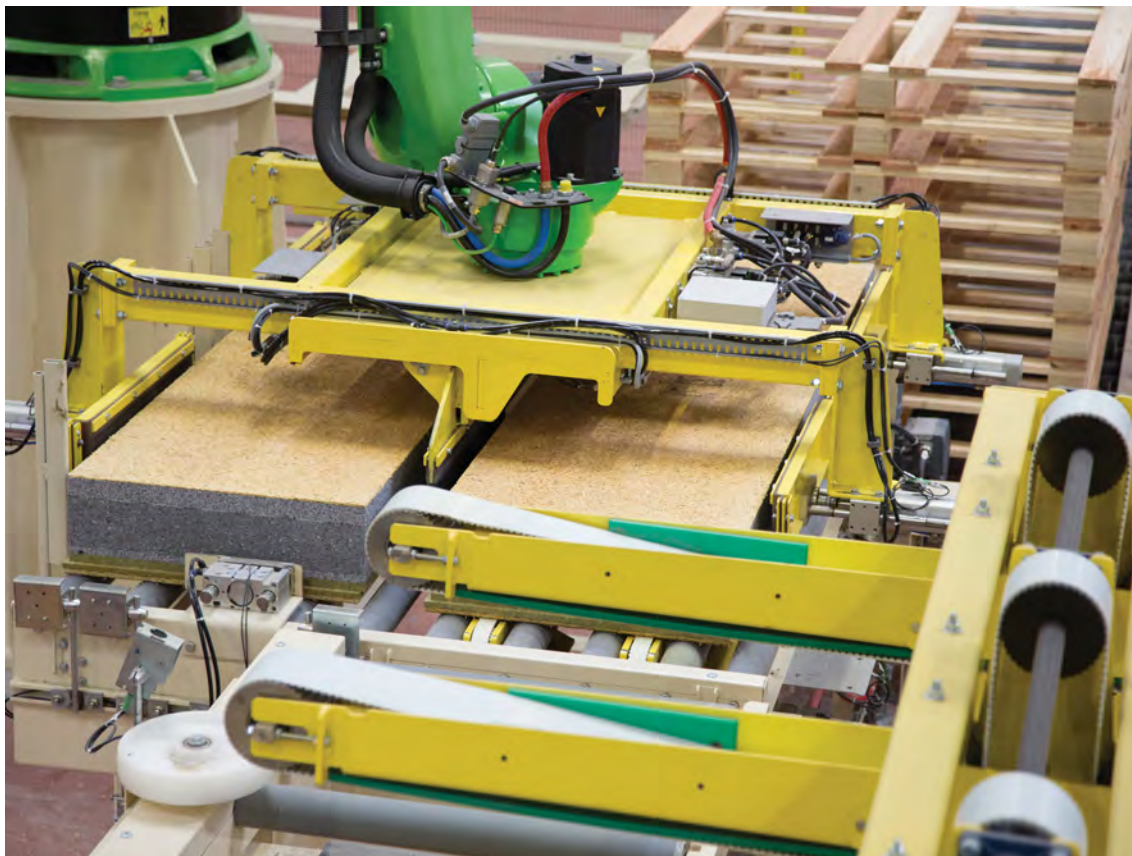
La nouvelle unité de façonnage Knauf Fibre, fruit d'un investissement de 5 millions d'euros.