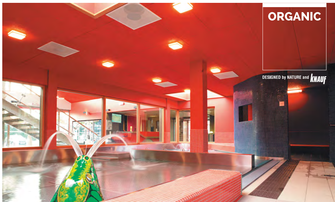
Piscine, Montigny-les-Metz (57).

Knauf accompagne ses solutions produits hautes performances d'une large panoplie de fixations et d'accessoires pour assurer une mise en œuvre dans les règles de l'art et une finition parfaite.