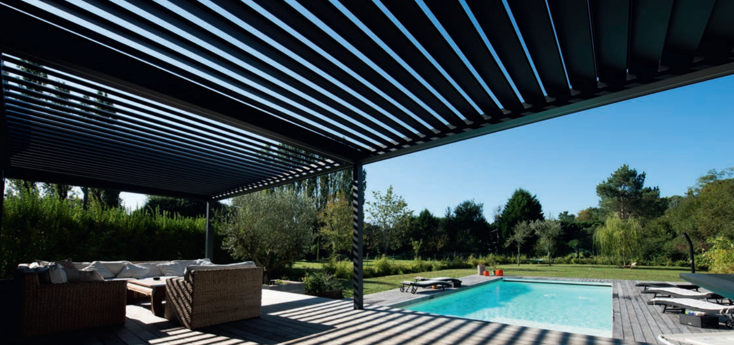
Lien unique entre l'intérieur et l'extérieur, la pergola Komilfo s'accompagne de nombreuses options de personnalisation pour créer un véritable espace de vie.