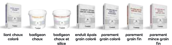
liant chaux coloré badigeon chaux badigeon chaux et silice enduit épais grain coloré parement grain coloré parement grain fin parement mince grain fin