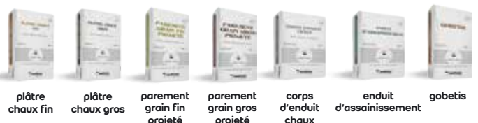
plâtre chaux fin plâtre chaux gros parement grain fin projeté parement grain gros projeté corps d'enduit chaux enduit d'assainissement gobetis