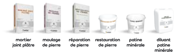
mortier joint plâtre moulage de pierre réparation de pierre restauration de pierre patine minérale diluant patine minérale