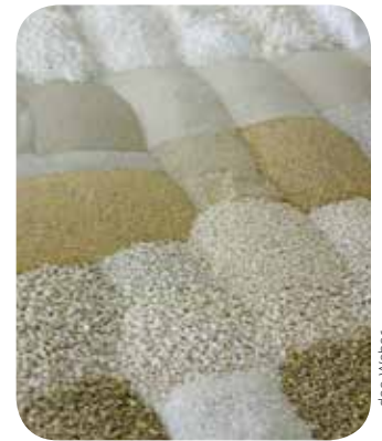
Chaux, sables de rivière, pigments minéraux : Les Enduits Georges Weber sont riches des ressources de la nature.