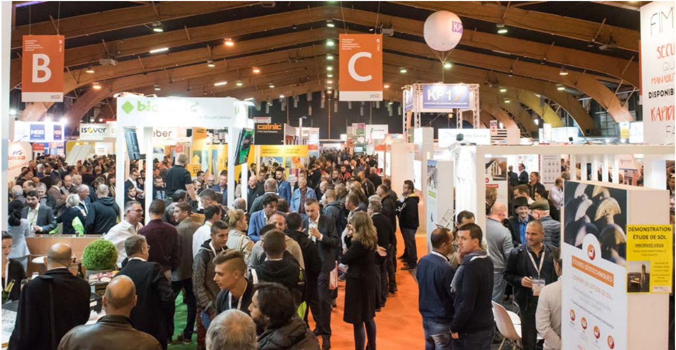
ARTIBAT 2018

Salon de référence et d'affaires fédérant tous les deux ans les acteurs de la filière BTP, ARTIBAT s'impose autant par sa dimension nationale due à la pluralité et l'envergure de ses exposants, que par les affaires générées et une proximité unanimement appréciées.