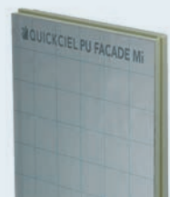
PU Façade MI