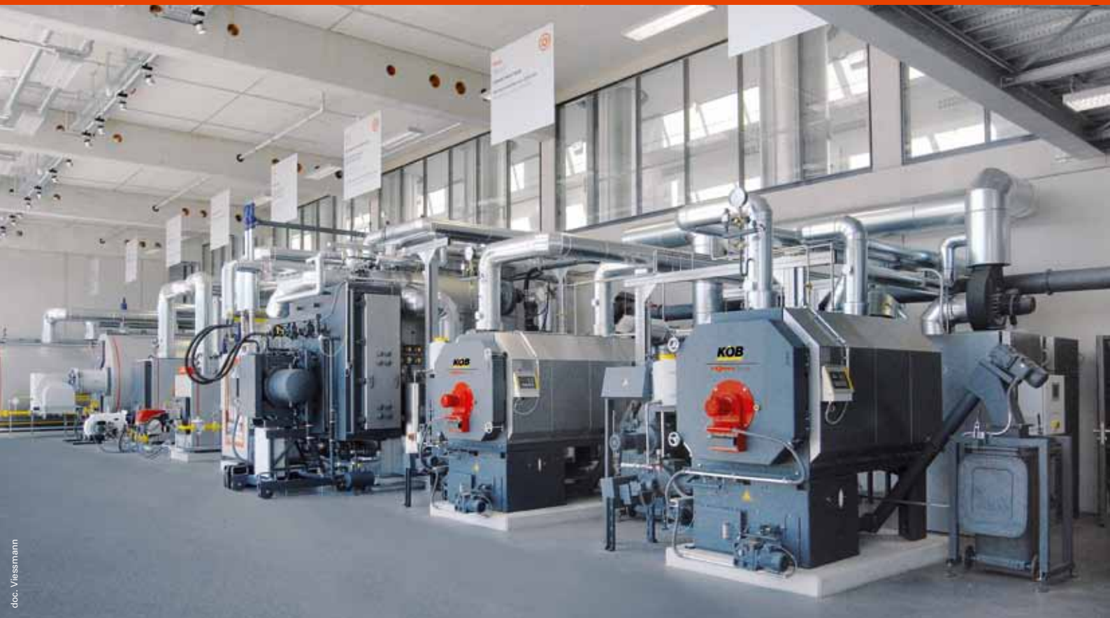
La chaufferie multi-énergies du siège du Groupe Viessmann en Allemagne.

En matière de chauffage et de production d'eau chaude sanitaire, Viessmann s'impose comme acteur majeur, quels que soient l'énergie, le type de bâtiment ou l'utilisation.