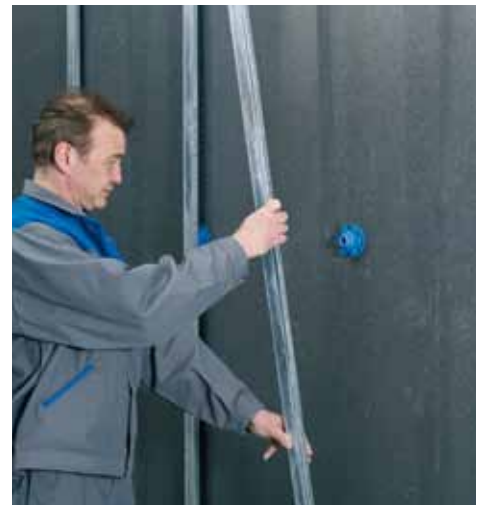
Vérifier l'étanchéité à l'air. Eventuellement, combler avec une mousse PU ou un adhésif aux joints. Puis, clipser la fourrure.