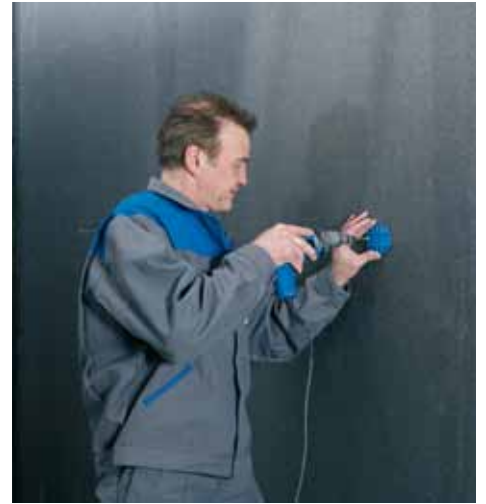
Visser la cheville SDF-S au travers de la platine.