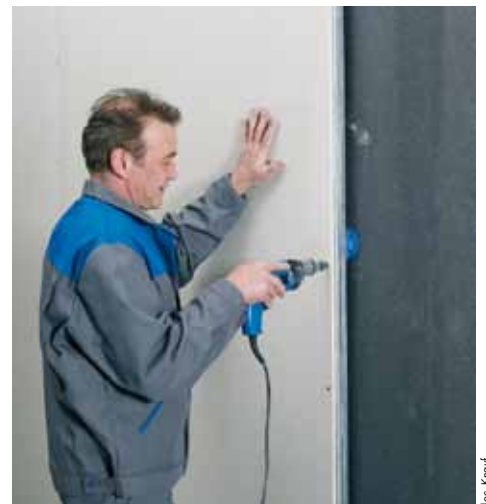
Visser les plaques. Faire les finitions.