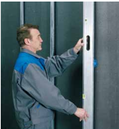
Régler le positionnement et la planéité.