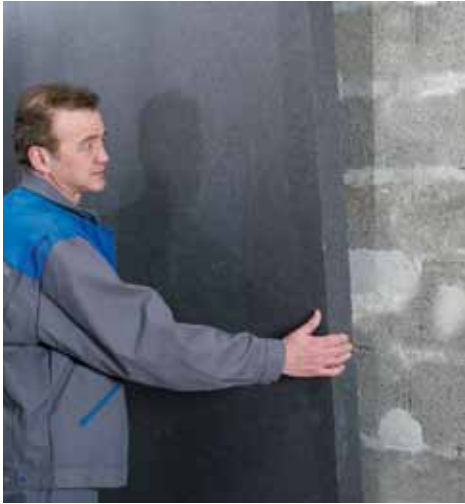
Poser l'isolant Knauf XTherm Ultra 30 Phonik, sans colle ni mortier.