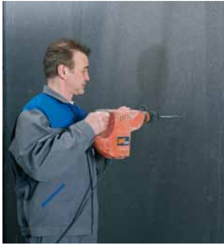
Tracer et percer les implantations des appuis Easy Click.