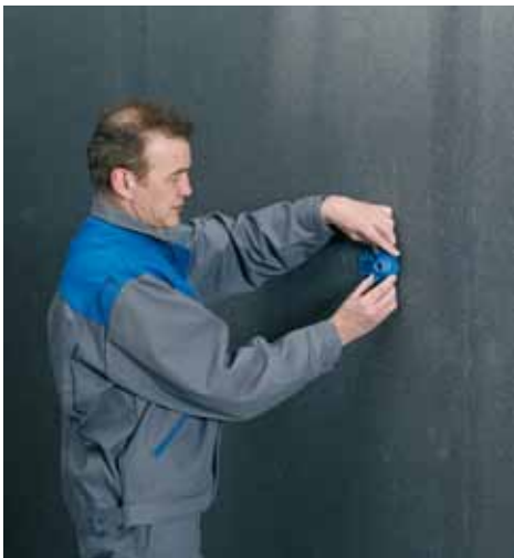
Assembler l'appui Easy Click.