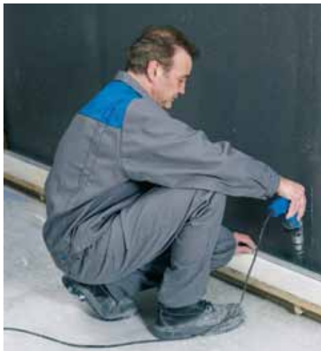
Fixer les rails F47 haut et bas, par chevillage ou pistocellement.