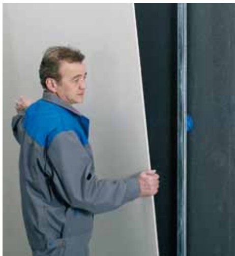
Mettre en place les câbles et conduits. Puis, poser les plaques.