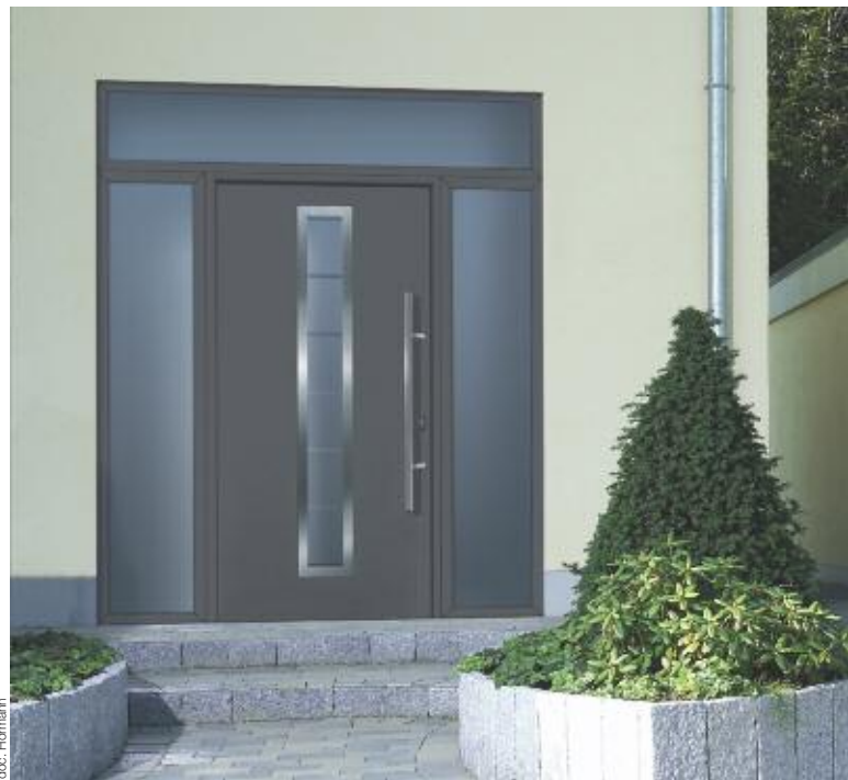
Ci-dessus, la porte d'entrée en acier double ou triple vitrage ThermoPro d'Hörmann en dimensions de 1.000 \times 2.100 \text{ mm} au prix de 1.757 \text{ € TTC} , plus parties latérales ( 2 \times 780 \text{ € TTC} ) et imposte ( 639 \text{ € TTC} ) hors pose.