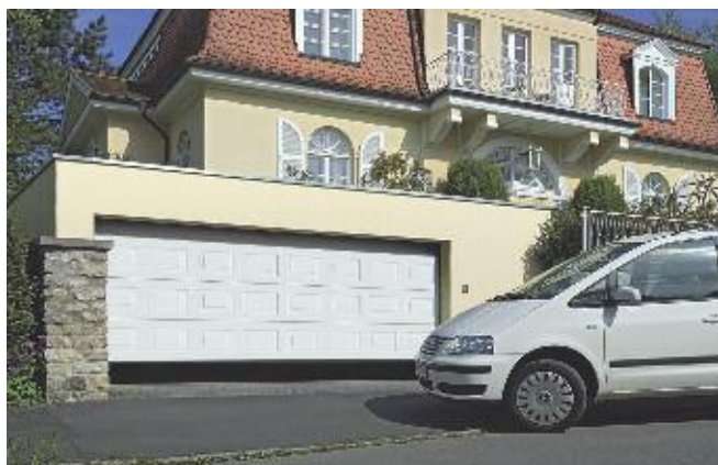
Ici, un exemple de porte sectionnelle Hörmann en dimensions 2.250 x 1.875 mm au prix public indicatif de 1.300 € TTC hors pose.

■ Portes sectionnelles Hörmann, sécurité et confort dans une large gamme de portes. Proposées en de nombreuses teintes, surfaces, coloris, matières, avec ou sans vitrage, et dans une large palette de dimensions (H. de 1.875 à 3.000 mm, L. de 2.250 à 5.500 mm), les portes de garage sectionnelles s'adaptent à toutes les configurations et aux envies de chacun. Offrant confort et sécurité au quotidien, ces portes présentent des performances techniques remarquables : sécurité anti-pincement et anti-relevage, étanchéité parfaite grâce à des joints latéraux, de sol, et intermédiaires, protection anti-corrosion et rupture de pont thermique du cadre dormant (en option). Cette porte peut être complétée par un portillon intégré ou indépendant.