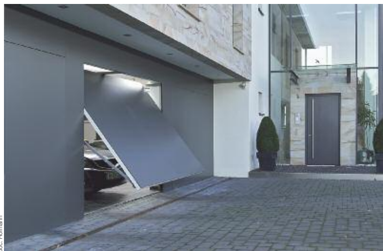
Ci-dessus, la porte de garage Berry (cadre uniquement et remplissage par l'utilisateur) à partir de 470 € TTC hors pose.

■ Porte enroulable RollMatic pour un espace optimisé dans le garage. Le système exclusif Hörmann de motorisation couplée à un arbre à enroulement permet une ouverture verticale de la porte offrant un gain de place latéral et sous plafond. Le RollMatic est également disponible en 9 coloris au choix, avec ou sans vitrage, et dans de nombreuses dimensions (H. de 1.900 à 3.000 mm, L. de 1.000 à 5.000 mm).