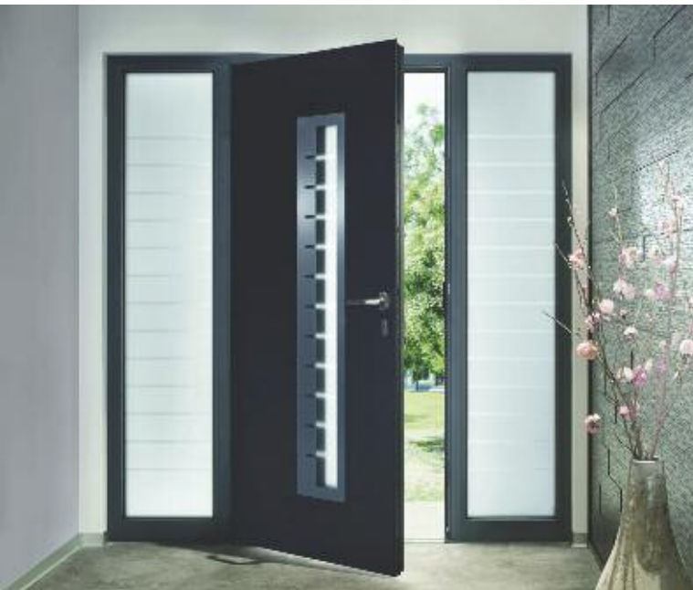
Ici, la porte d'entrée TopPrestige Plus en dimensions sur-mesure, commercialisée à 4.116 \text{ € TTC} (plus parties latérales 2 \times 1.328 \text{ € TTC} ) hors pose.