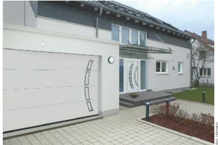
Design et esthétique à l'honneur avec les portes de garage et d'entrée parfaitement assorties. Ci-dessus, la porte de garage Hörmann (dimensions de 2.250 \times 1.875 \text{ mm} ) est vendue à 1.859 \text{ € TTC} hors pose.

■ Porte d'entrée ThermoPro : cette porte en acier avec double ou triple vitrage assure une sécurité et une isolation thermique élevées avec un coefficient U pouvant varier de 1.7 \text{ W/m}^2 \cdot \text{K} à 1.2 \text{ W/m}^2 \cdot \text{K} selon les modèles. Cette porte bénéficie également d'une serrure 5 points.