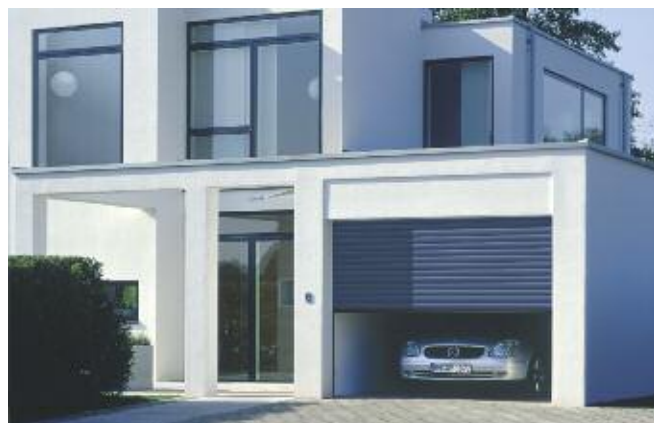
La porte de garage enroulable RollMatic avec motorisation est commercialisée à partir de 1.670 € TTC hors pose.

■ Porte enroulable RollMatic pour un espace optimisé dans le garage. Le système exclusif Hörmann de motorisation couplée à un arbre à enroulement permet une ouverture verticale de la porte offrant un gain de place latéral et sous plafond. Le RollMatic est également disponible en 9 coloris au choix, avec ou sans vitrage, et dans de nombreuses dimensions (H. de 1.900 à 3.000 mm, L. de 1.000 à 5.000 mm).