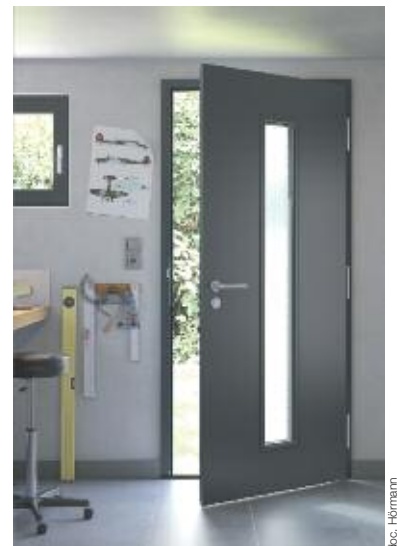
La porte d'extérieur universelle MZ Thermo d'Hörmann (dimensions de 875 \times 2.000 \text{ mm} ) commercialisée à 710 \text{ € TTC} hors pose.

Toujours dans un souci d'isolation thermique élevé Hörmann complète sa gamme de portes pour la maison par une porte d'extérieur universelle, la MZ Thermo. Résistante aux intempéries et à l'usure, elle convient idéalement pour les caves, cabanes à outils, annexes ou exploitations agricoles. Grâce à son isolation thermique ( 1,2 \text{ W/m}^2 \cdot \text{K} ) et acoustique ( 39 \text{ dB} ) accrue, elle s'avère la solution idéale pour tous les besoins d'entrées secondaires. Elle peut également être équipée d'un vitrage rectangulaire sur toute la hauteur.