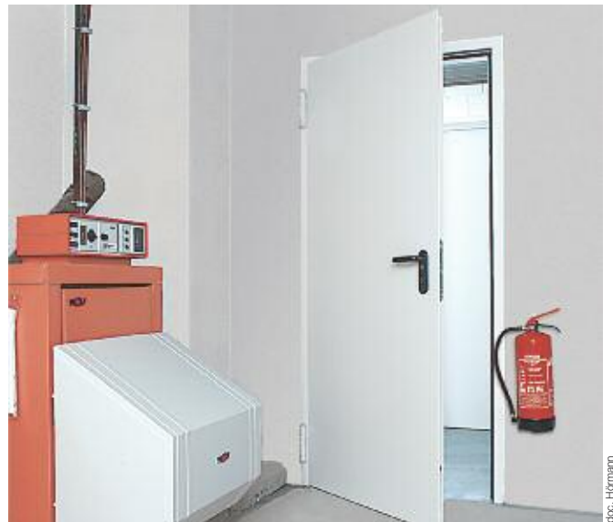
La porte coupe-feu Hörmann, une solution idéale pour séparer la chaufferie des autres pièces à vivre. La porte coupe-feu (dimensions 800 x 2.000 mm) est vendue à 299 € TTC hors pose.

■ Portes coupe-feu HF 30 ou HF 60, la maison protégée contre les incendies. Pour la chaufferie ou la réserve à fuel par exemple, Hörmann propose différents modèles de portes coupe-feu 30 mn ou 1 h pour protéger la maison contre les risques de propagation d'incendie. Ces portes à double paroi en tôle d'acier sont agréées par les organismes officiels reconnus pour le marché français des portes coupe-feu.