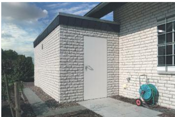
La porte de sécurité KSi d'Hörmann est vendue à 377 € TTC hors pose (dimensions de 800 x 2.025 mm).

■ Porte de sécurité KSi, le garage et la cave équipés contre les effractions. Avec son panneau à double paroi de 40 mm d'épaisseur en tôle d'acier, la porte KSi est équipée d'un verrouillage multiple et d'une garniture de sécurité à bouton fixe protégée contre l'arrachement et la perforation du cylindre. Ses paumelles de sécurité en trois parties, et un point de sécurité anti-dégondage complètent ses atouts principaux. Cette porte existe également dans une version à rupture de pont thermique, la KSi Thermo.