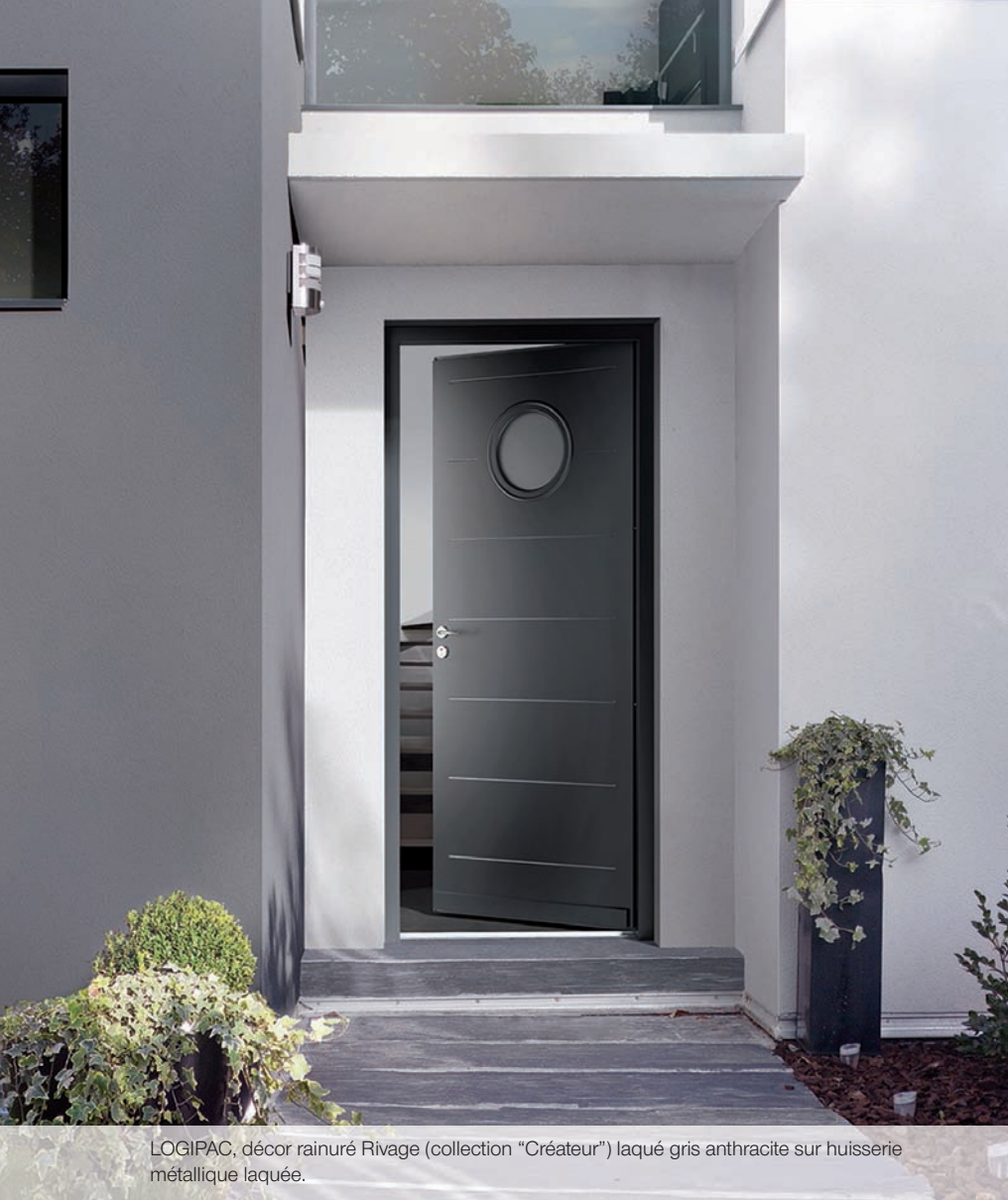
LOGIPAC, décor rainuré Rivage (collection "Créateur") laqué gris anthracite sur huisserie métallique laquée.