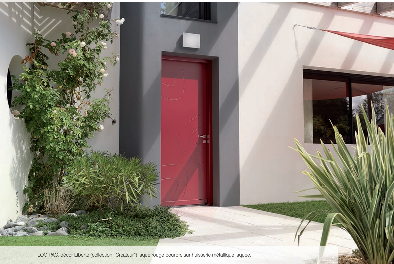
LOGIPAC, décor Liberté (collection "Créateur") laqué rouge pourpre sur huisserie métallique laquée.