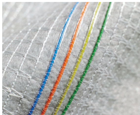
L'intégration de lignes de fibre optique au géotextile TenCate GeoDetect® permet l'obtention d'informations en temps réel sur le comportement des structures.

Associant la performance du géotextile à la technologie de pointe des fibres optiques, TenCate GeoDetect® permet d'obtenir des informations précises sur les déformations du sol et la température des structures en terre, donnant ainsi aux maîtres d'ouvrage et aux concepteurs un accès direct au comportement réel des structures.