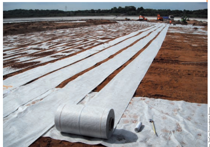
Installation de plus de 3.500 m 2 de bande capteur TenCate GeoDetect® en fond de bassin de stockage d'effluents.

La solution d'auscultation a indiqué le développement de déformations lors des réparations à cause de la rugosité élevée du fond de forme, mais aucune déformation liée à un fontis n'est apparue un an et demi après son installation.