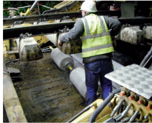
Installation de deux bandes du capteur TenCate GeoDetect® lors de la réfection d'une section de plus de 3 km de voies ferrées aux Pays-Bas.

Dans ce cas précis, l'association d'une structure de renforcement par géotextile avec un système d'auscultation pour détecter les mouvements du sous-sol se révèle donc un véritable succès.