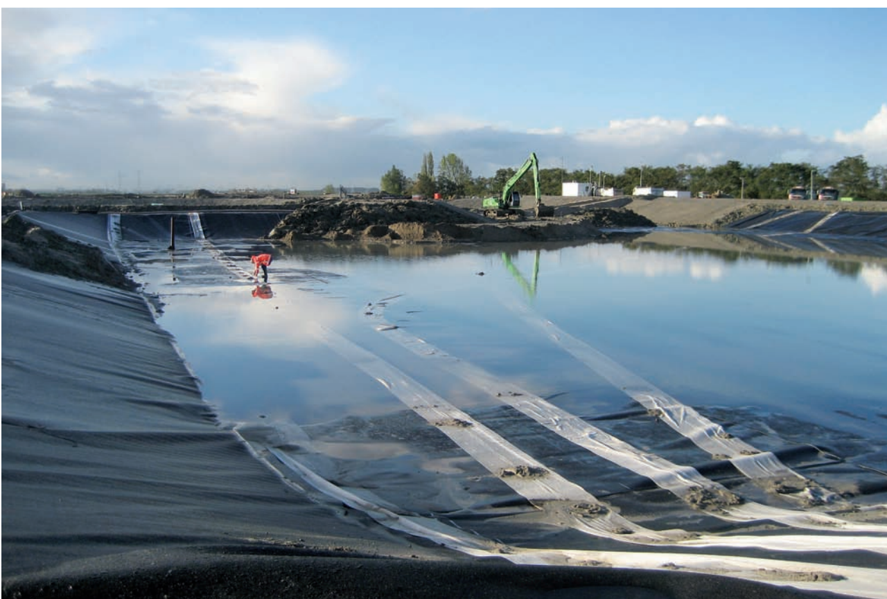
Suivi des déformations d'une étanchéité par géomembrane en couverture d'une installation de stockage de déchets.