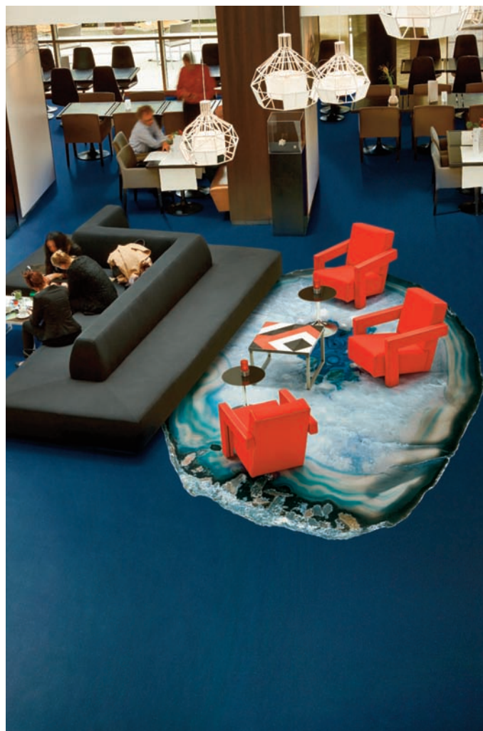
doc. Forbo Flooring Systems

Composés à 97 % de matières premières naturelles dont 75 % renouvelables pour Marmoleum (huile de lin, colophane, farine de bois, charges minérales...) ou de matériaux recyclés ( Allura , Tessera , Eternal ...) et recyclables, les revêtements Forbo contribuent résolument à un environnement sain, hygiénique et confortable, impactant positivement la santé des usagers.