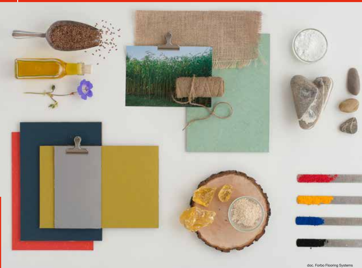
doc. Forbo Flooring Systems

Le linoléum de Forbo est fabriqué à 97% de matières premières recyclables (huile de lin, résines naturelles, fibres de bois et calcaire pulvérisé, jute, pigments colorés sans effets sur l'environnement). Extrêmement robuste, hygiénique et résistant à l'usure, il offre un large panel de mises en œuvre, au sol comme sur le mobilier, pour des concepts de création d'espace bien au-delà des utilisations classiques.