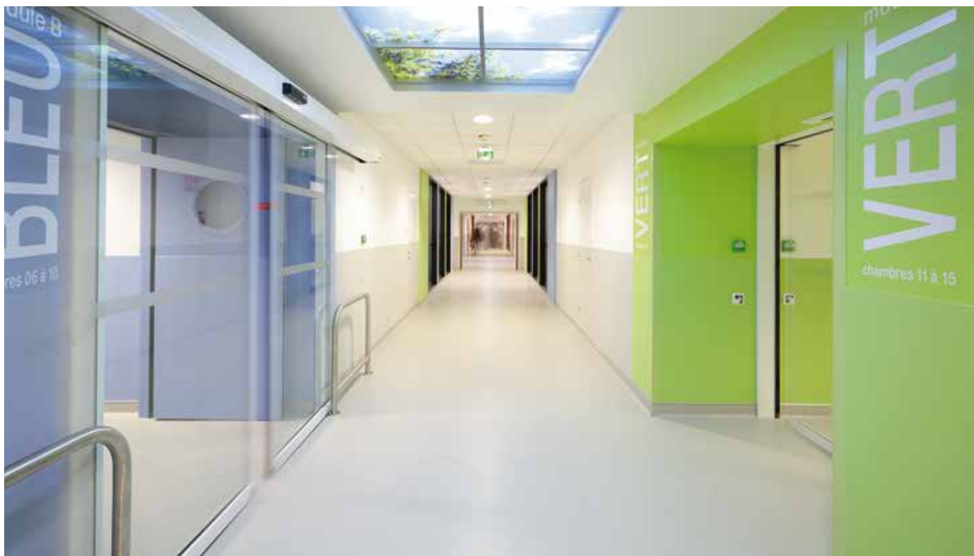
CHU Montpellier - Marie-Camille Lucat © IMAGINE architectes - Montpellier