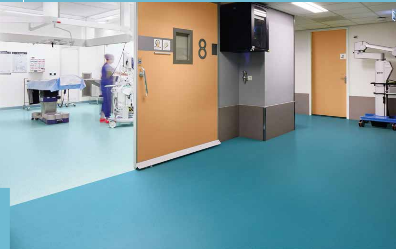
doc. Forbo Flooring Systems

Fort de l'importance qu'il attache à l'interaction des revêtements de sol avec les individus, Forbo Flooring Systems s'applique à concevoir des solutions contribuant résolument à un environnement sain, hygiénique et confortable, impactant positivement la santé des usagers.