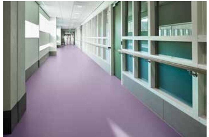
doc. Forbo Flooring Systems

De même, les performances techniques de Sarlon tech 15 dB remportent tous les suffrages des professionnels de santé : rouabilité facilité et équivalente à un sol compact, excellente résistance au poinçonnement comme à l'abrasion, tout en apportant un confort à la marche (envers haute densité et haute résilience) contribuant à réduire la fatigue physique des soignants lors des déplacements des charges lourdes et une efficacité acoustique de 15 dB. Affichant une résistance inégalée à la bétadine et à l'éosine, Sarlon tech 15 dB bénéficie de propriétés antibactériennes grâce à son traitement à base d'ions argent. Hygiène et simplicité d'entretien garanties !