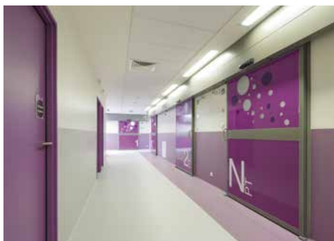
Centre Hospitalier de Cholet - AMA associés - PFFE Cholet - © Frédéric Baron