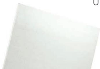
Plaque Knauf HydroProof® BA13, 1,2 x 2,6 ou 3,0 m