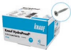
Vis Knauf HydroProof® TTPC 25 ou 35 mm