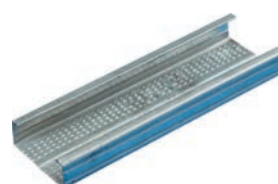
Fourrure Knauf F47 Z 275