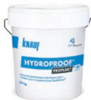
Enduit Knauf Proplak® HydroProof®, enduit prêt à l'emploi, seau de 20 kg