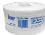
Bande à joint Knauf HydroProof® en fibre de verre non-tissée, largeur 50 mm x 25 ml