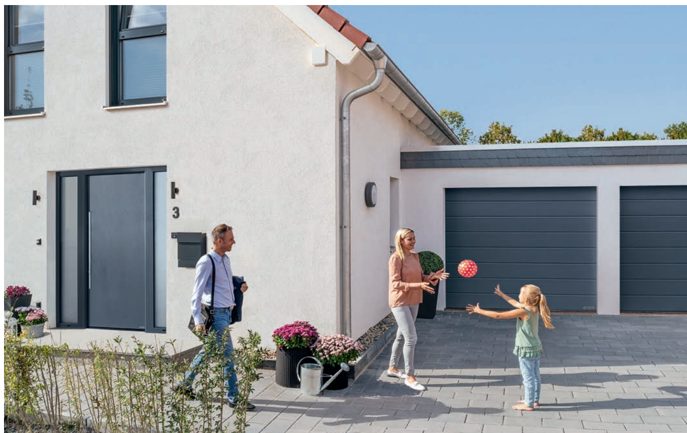
Promotion annuelle Hörmann : s'offrir la qualité du leader européen en porte d'entrée (dès 1 698 €* ) et en porte de garage motorisée (à partir de 949 €*).