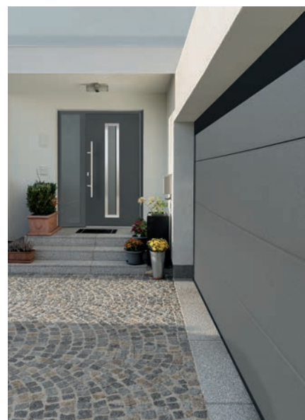
Intemporelle et élégante, la nouvelle finition de surface lisse Planar sur porte de garage en rainures L se décline en 6 coloris promotionnels et 3 décors.

Les portes de garage sectionnelles motorisées RenoMatic d'Hörmann de la campagne promotionnelle 2019 sont proposées en deux finitions. Avec rainures M et aspect Woodgrain façon traits de scie, elles sont disponibles dès 949 €*. Avec rainures L et la nouvelle surface Planar à l'élégant aspect lisse, elles sont disponibles à partir de 1 149 €*. Rappelons que les portes RenoMatic, composées de panneaux à double paroi isolés de 42 mm d'épaisseur, garantissant isolation thermique élevée, grande stabilité et fonctionnement silencieux. Ces portes de garage se déclinent dans 6 couleurs Woodgrain et 3 décors. Leur motorisation ProMatic (système radio - deux hauteurs d'ouverture) est incluse de série et avec l'émetteur HSE 4 BS. Dimensions promotionnelles : 2 375 x 2 000 mm, 2 375 x 2 125 mm, 2 500 x 2 000 mm et 2 500 x 2 125 mm.