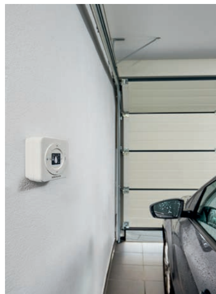
Capteur climatique HKS.