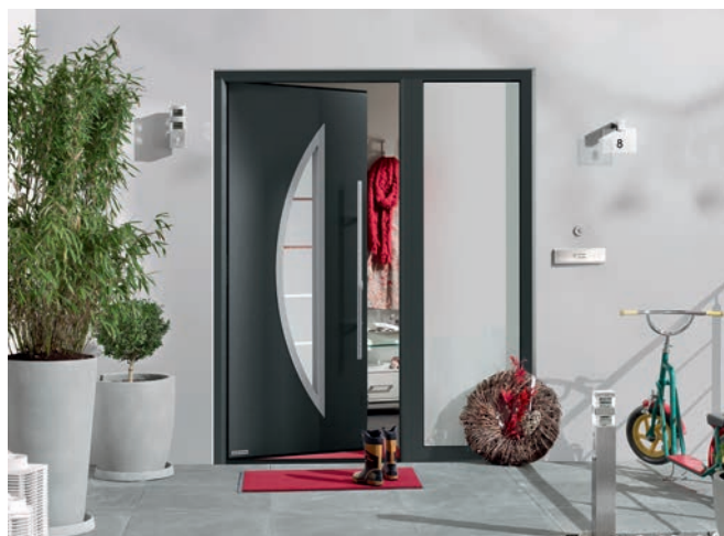
Porte d'entrée acier/aluminium Thermo65, équipée de série d'une serrure de sécurité 5 points et d'un système anti-effraction certifié CR2.

Soulignons enfin la disponibilité du système de motorisation de porte d'intérieur PortaMatic, une réponse idéale pour les personnes à mobilité réduite. Elle est d'ailleurs dotée, en exclusivité, d'éclairage Led et du système de sécurité BiSecur (détection d'objets, signaux d'alerte).