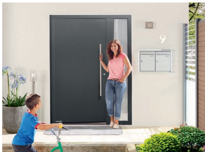
Porte d'entrée aluminium ThermoSafe, esthétique, isolation et anti-effraction à l'honneur.