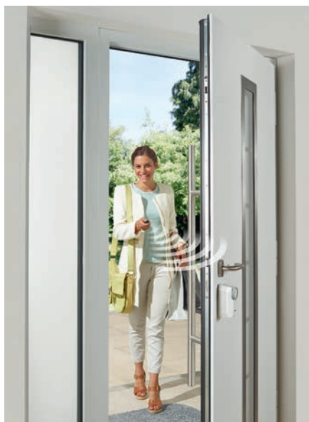
Motorisation de serrure de porte sans fil SmartKey.