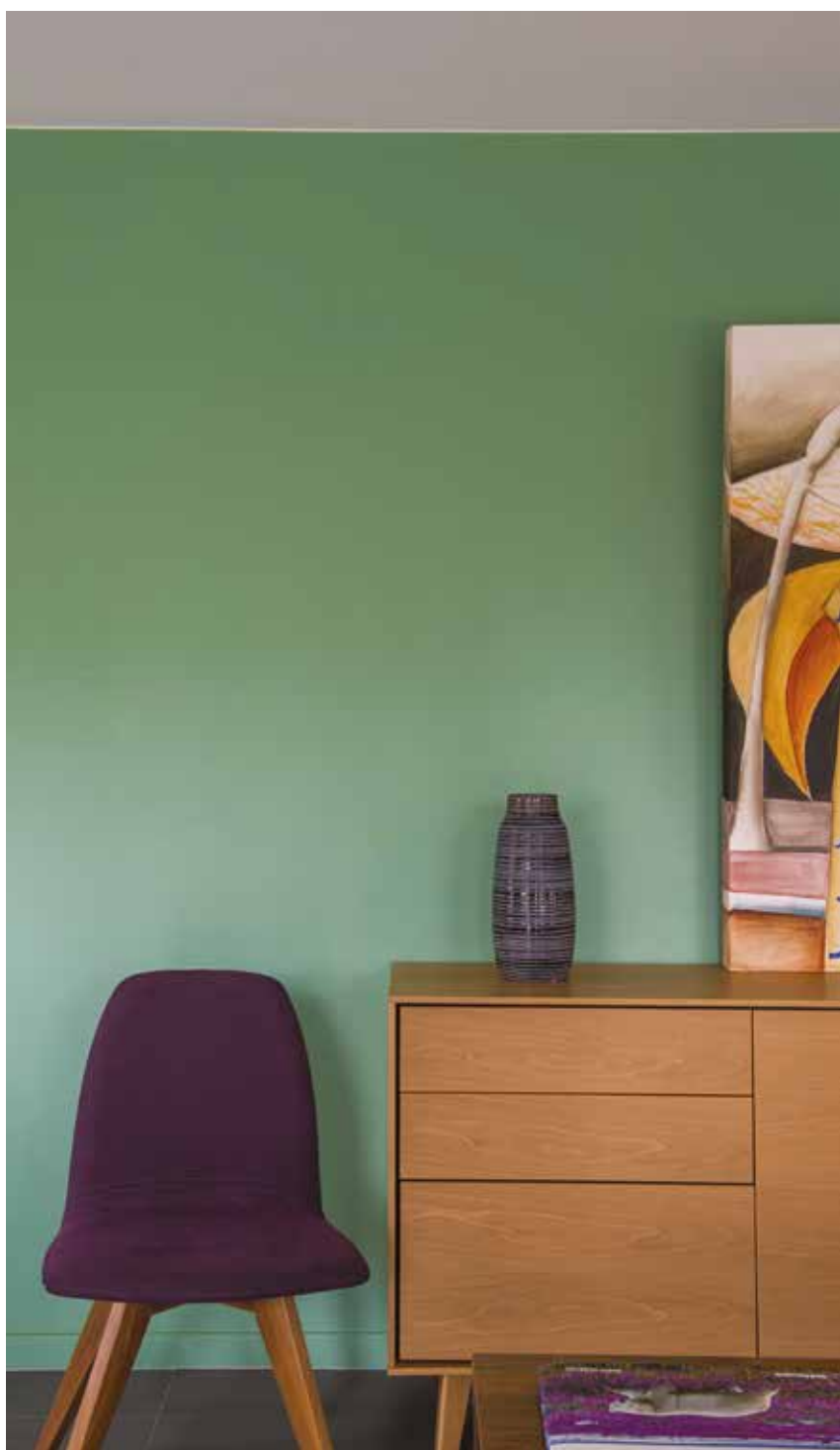
Doc. SEIGNEURIE® - Pantex Soie Ch2 0753 Vert Simson

Affichant un indice de qualité de l'air intérieur A+, ces nouvelles peintures Pantex bénéficient également de labels reconnus : NF Environnement pour le Pantex Mat et Ecolabel pour les Pantex Velours, Soie et Satin . Elles sont donc particulièrement adaptées pour les chantiers de haute qualité environnementale telles que HQE®, LEED ou encore BREEAM®.