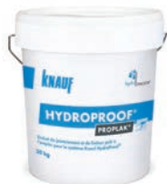
Enduit Knauf Proplak® HydroProof®, enduit prêt à l'emploi, seau de 20 kg