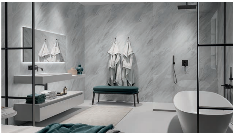
Habillage Mural : Marbre Sirocco - Extramat - Nuance

D'entretien facile , les solutions Polyrey bénéficient intrinsèquement d'une protection Sanitized® à base d'ions argent, garante d'une hygiène optimale (destruction de plus de 99,9 % des bactéries) tout au long de leur vie. A très faibles émissions de COV, sans nanoparticule et chimiquement inertes, elles sont classées A et A+, contribuant à préserver la qualité de l'air intérieur. Elles bénéficient aussi des certifications Greenguard et Greenguard Gold reconnues par les programmes de développement durable et emblématiques de l'engagement de Polyrey pour un environnement protégé ainsi qu'une santé préservée.