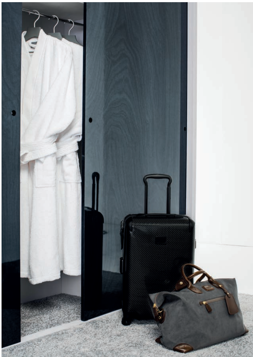
Portes de dressing : Canopée - Brillant - HPL Monochrom