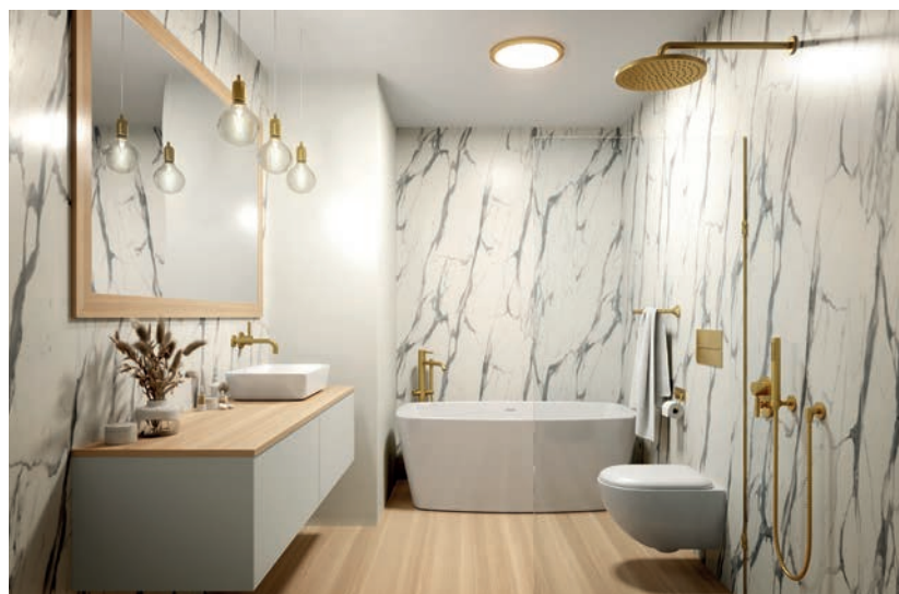
Habillage Mural : Marbre Veneto - Extramat - Système de panneaux étanches Nuance