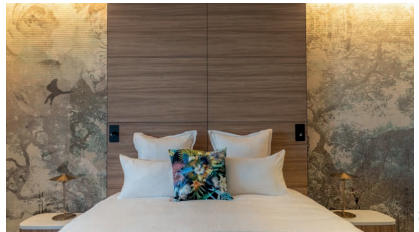
Tête de lit : Noisetier Naturel - Extramat - Mélaminé Panoprey®