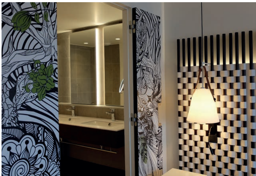
Portes : décor personnalisé « Signature Création »

Précisons aussi que la pose de mélaminés et stratifiés Polyrey s'accompagne d'une propreté d'intervention exemplaire (aucune bâche nécessaire pour prévenir les coulures de peintures par exemple, très peu de poussière) et d'une mise à disposition ultra rapide des locaux (exit les temps de séchage de colle interminables), répondant pertinemment aux enjeux du marché de la construction en général et du segment hôtelier en particulier (délais de chantiers raccourcis et optimisation de la rentabilité).