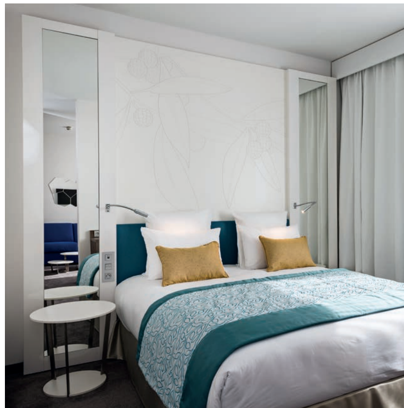
Tête de lit et mobilier : Blanc Absolu - FA - Stratifié Compact Monochrom

Enfin, soulignons que Polyrey met à disposition des porteurs de projets sa bibliothèque digitale « Signature Library », régulièrement actualisée donc toujours au cœur des tendances, offrant un très large panel de plus de 300 décors . Par ailleurs, Polyrey propose également un service de personnalisation « Signature Création » permettant de créer des décors uniques et exclusifs.