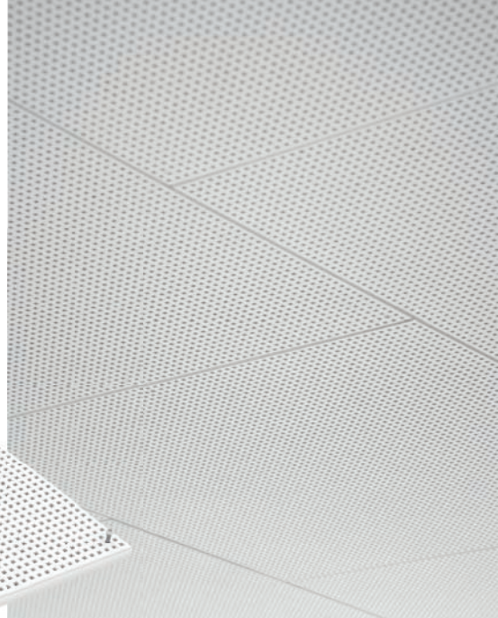
Pose à joint de pierre.