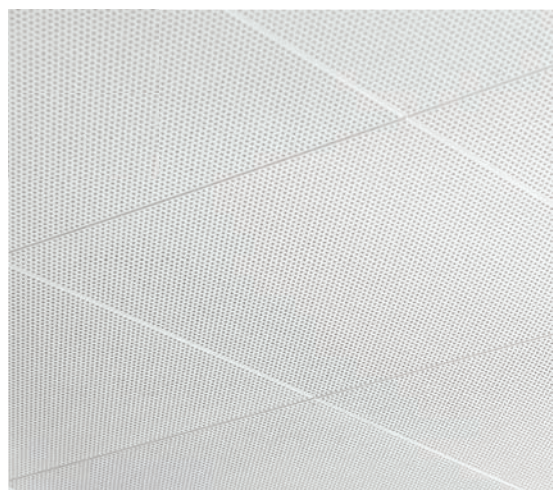
Pose à joint aligné.