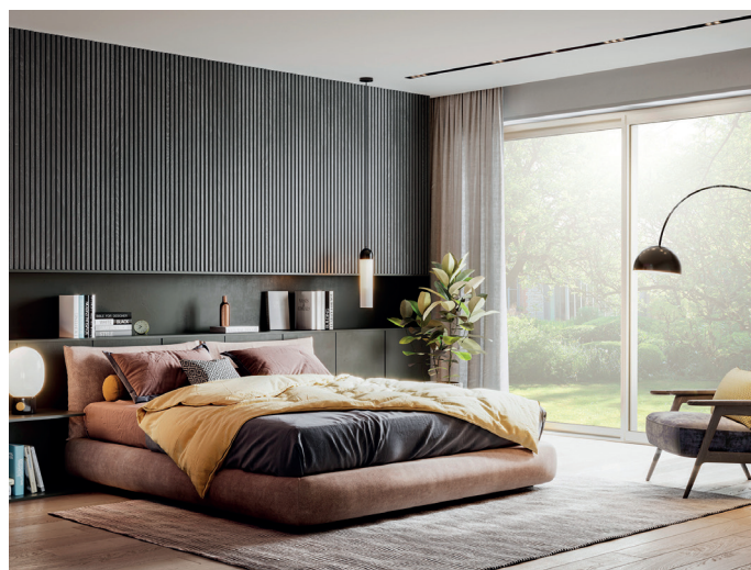
Nouveau concept de coulissant VEKASLIDE Hi-5, réunissant les meilleurs atouts d'un coulissant et d'une fenêtre à frappe.

À propos de VEKA : Expert en extrusion de profilés PVC et concepteur de systèmes de menuiseries (fenêtres, volets et portes), VEKA, dont le siège est basé en Allemagne, est un groupe indépendant et familial qui rayonne au niveau international. Avec 6 900 collaborateurs répartis sur 41 pays et un chiffre d'affaires de 1,8 Md€ en 2022, l'entreprise cultive des valeurs de qualité, de service et de développement durable. Acteur majeur sur le marché français des menuiseries, VEKA France est implantée à Thonon-les-Bains, en Haute-Savoie, depuis 1988, et produit 94% des profilés VEKA vendus en France.