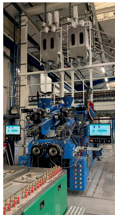
Nouvelle ligne de co-extrusion VEKA permettant l'intégration de matière recyclée au cœur des profilés PVC