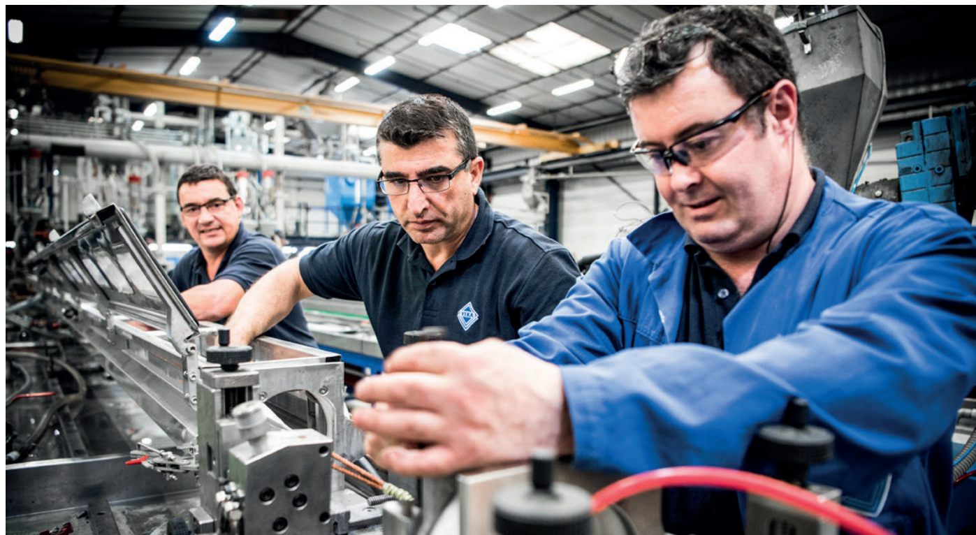
Qualité, Fiabilité, Engagement comptent parmi les valeurs chères à l'industriel VEKA

Aujourd'hui, une vingtaine de postes en CDI sont à pourvoir sur le site de Thonon-les-Bains, essentiellement dans les métiers de la Production (Extrusion/Plaxage et Maintenance). Plusieurs initiatives sont d'ailleurs conduites pour non seulement fidéliser les équipes actuelles, mais aussi renforcer l'attractivité de l'entreprise dans la région et attirer de nouvelles compétences. Après une première convention interne en juillet dernier, un programme de cooptation a ainsi été mis en place le 1 er septembre pour encourager la recommandation de nouveaux collaborateurs. Et c'est sur les écrans du Ciné Léman à l'automne, que l'on retrouvera les équipes VEKA afin de faire connaître et promouvoir l'entreprise.