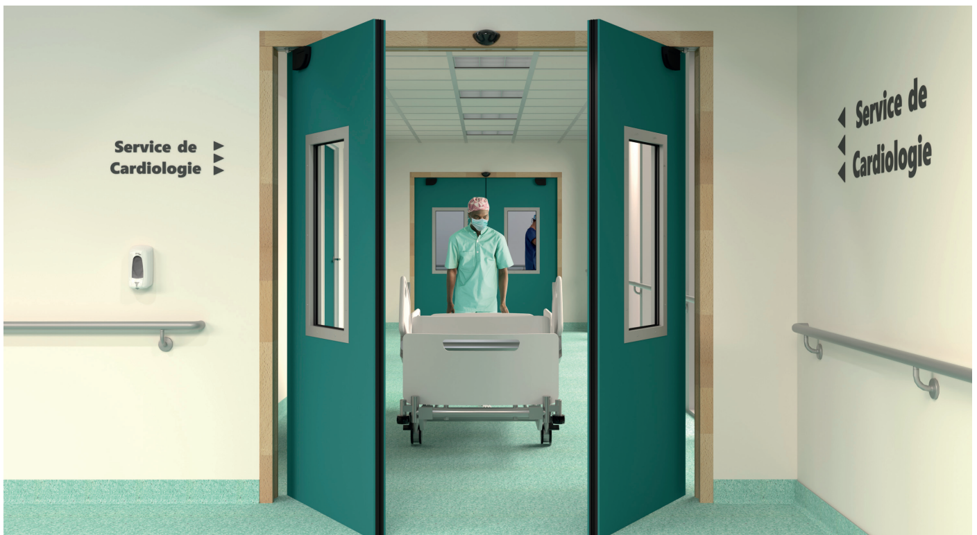
Les nouveaux blocs-portes D.A.S. pivot linteau motorisé de MALERBA

Pour MALERBA, l'année 2023 est particulièrement dense en actualités. Au-delà d'une multitude de nouveaux produits dévoilés sur le salon Artibat, précisons que MALERBA a aussi mis en place sa démarche RSE. L'industriel vient d'ailleurs éditer son premier rapport éponyme. Un recueil qui confirme tout son engagement, qu'il s'agisse d'économies d'énergie comme de décarbonation, sans oublier son implication sur le volet sociétal et plus particulièrement l'attention portée à la sécurité, la santé et au bien-être de l'ensemble de ses collaborateurs. De plus, l'expansion de son réseau MALERBA DISTRIBUTION continue avec l'ouverture, le 11 septembre dernier, du 8 ème site : MALERBA DISTRIBUTION Grand Est. Un centre de distribution et de personnalisation des produits MALERBA les plus courants, basé à Marlenheim (67), qui a pour objectif d'apporter toujours plus de services aux clients de la région Grand Est (menuisiers, serruriers, artisans, poseurs...). Enfin, mentionnons que MALERBA annonce également de prochains projets de construction avec un nouveau siège social ainsi qu'une plateforme logistique, tous deux localisés à Thizy-les-Bourgs, à une dizaine de kilomètres de son siège social historique.