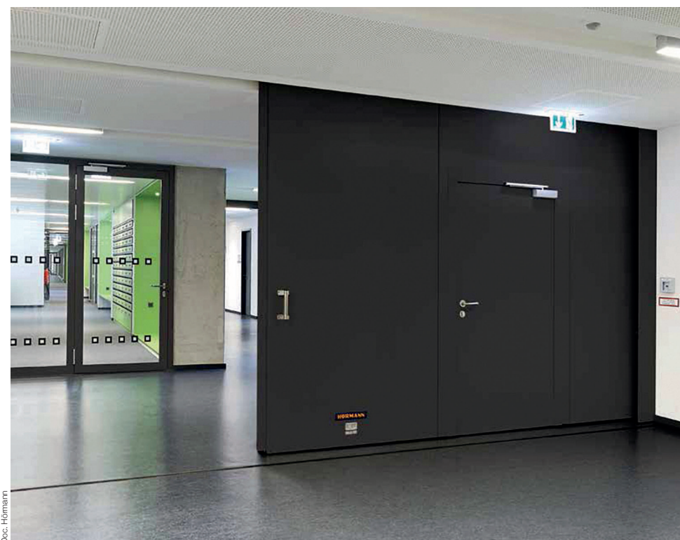
Doc. Hörmann Portes coulissantes Coupe-feu FST

Coupe-feu EI230, pare-feu EI260, EI2120 ainsi qu'en « multifonction », les portes coulissantes FST d'Hörmann sont proposées en modèles 1 vantail, 2 vantaux et en exécution télescopique (double ou triple panneau). Revendiquant un design minimaliste sans rivet ni perçage apparent, avec une fermeture affleurante sans profilé d'entrée (jusqu'à FST30), elles permettent de plus d'avoir un portillon indépendant sans seuil répondant aux critères des issues de secours. Habillées de trois types de surfaces possibles (Tôle d'acier lisse, acier inoxydable V2A grain 240 ou Pearlgrain), garanties de robustesse et de résistance, elles se déclinent dans 6 coloris standards, en RAL au choix ou selon le nuancier NCS et se destinent particulièrement aux entrepôts et espaces à forte fréquentation. Notons qu'elles complètent idéalement la gamme coupe-feu la plus vaste d'Europe. Contrôlées et certifiées selon la norme EN 12605, classe C5 (test de durabilité avec 200 000 manœuvres), elles peuvent être équipées des motorisations SupraMatic HT et ITO 400 FU avec démarrage et arrêt progressifs de série, sans à-coups. Cette solution est associée à une commande aisée par émetteur, bouton-poussoir ou contacteur à clé. En cas d'incendie, un mécanisme breveté débraye la motorisation, tandis que des contrepoids assurent une fermeture fiable de la porte.