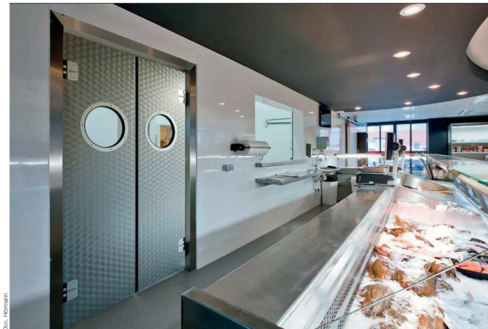
Doc. Hörmann Portes va-et-vient

Hygiéniques, robustes et fonctionnelles, ces nouvelles réponses Hörmann s'implanteront, par leurs performances, dans des domaines aussi variés que l'hôtellerie-restauration, l'industrie agro-alimentaire, les boucheries, les boulangeries, les entrepôts frigorifiques... Equipées de panneaux de porte agro-alimentaire en polyéthylène garantis 10 ans, résistantes aux chocs, à l'eau comme au froid, ces solutions Hörmann se déclinent en 10 couleurs et sont également disponibles avec un panneau de porte en acier inoxydable avec noyau de deux designs différents. Dotées d'équipement antipincement et anticollision en option, elles sont pourvues, de série, de paumelles robustes et sans entretien, avec un angle d'ouverture de 90° ou 180° par vantail. Synonymes d'un montage simple et rapide grâce à un degré de préfabrication élevé, elles offrent, de plus, diverses solutions de fixation en fonction du type de mur.