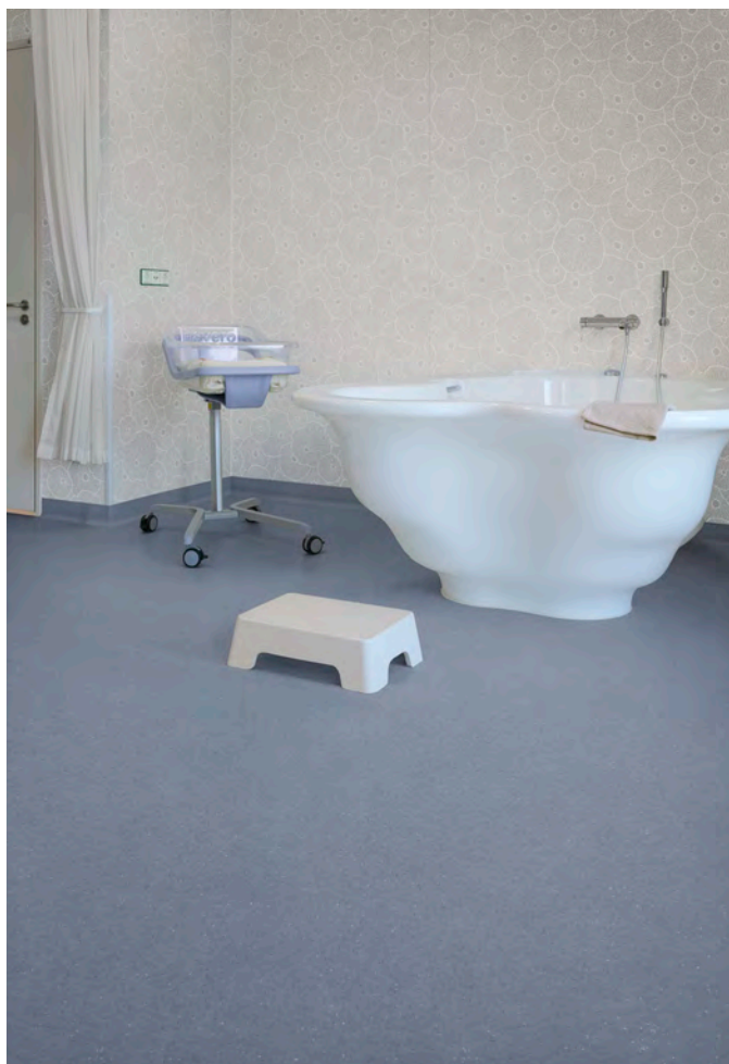
Sol : Surestep balance grey lavender. Mur : Onyx+ lotus ivory