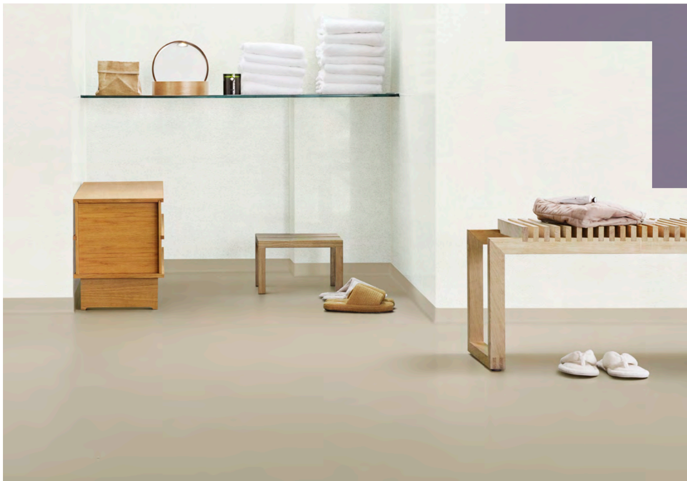
Sol : Surestep laguna sand. Mur : Onyx+ hessian ivory