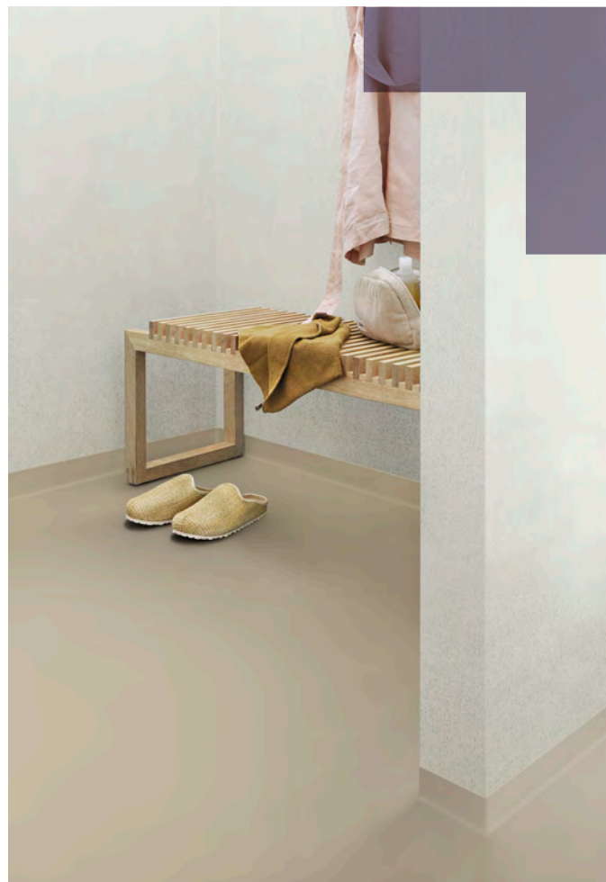
Sol : Surestep laguna sand. Mur : Onyx+ hessian ivory