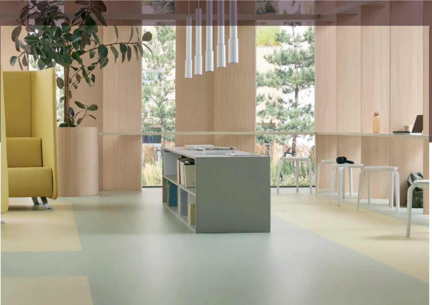
Sphera element multi meadow et fennel