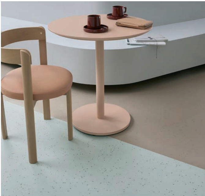
Sphera element multi vintage