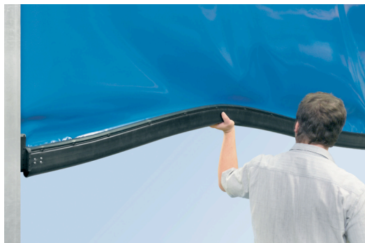
La grande flexibilité verticale de Softedge d'Hörmann : le nouveau système breveté anticollision