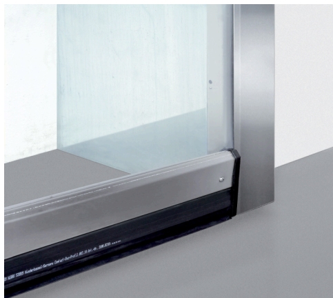
Le tablier transparent de la porte souple rapide V 3015 Clean remplit les rails de guidage pour que la pression de l'air reste constante.

S'il existe un autre domaine d'activité où l'hygiène doit être parfaite, c'est bien l'industrie chimique et pharmaceutique. Une nouvelle fois, Hörmann offre une solution pertinente, le défi consistant à maintenir à pression constante les « salles blanches », des pièces où sont regroupées les activités sensibles de nombreuses entreprises et dont la pression se révèle différente de celle des zones de travail dites « normales ».