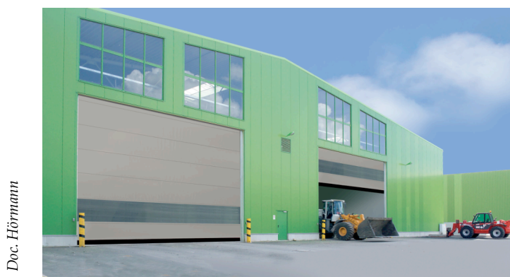
La porte souple rapide V 10008 convient à des fermetures extérieures d'une largeur maximale de 10 mètres.

Autre défi de taille relevé par Hörmann : respecter les contraintes de sécurité, particulièrement élevées, liées aux portes pour baies de grand format, soumises à une pression importante et exposées au vent. Destinée à des fermetures extérieures d'une largeur maximale de 10 mètres, la porte souple rapide Hörmann V 10008 se distingue par sa vitesse d'ouverture, jusqu'à 0,8 mètre par seconde à partir d'une largeur de 6.000 mm, et par sa résistance au vent (classe 2 selon la norme EN 12424). De nombreux contrevents, ainsi que les doubles contacts sur le profil de fermeture, permettent de limiter les efforts horizontaux des baies et d'assurer une mobilité parfaite de la porte, en toute stabilité. La porte V 10008 est équipée d'une commande à convertisseur de fréquence (commande FU) de série.