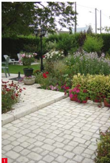
doc. JONCHERE chez RESEAU PRO

Ajoutons également la mise à disposition des professionnels d'un espace privilégié sur le site internet reseau.pro , leur permettant d'obtenir un devis ou de passer leurs commandes en ligne, 7 jours / 7, 24 heures / 24, avec leurs tarifs personnalisés.