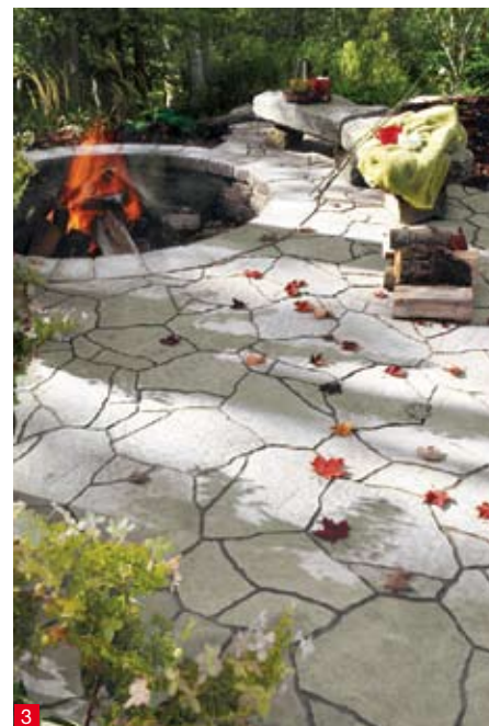
doc. STRADAL chez RESEAU PRO

1 Ce pavé d'Antin est prisé pour des utilisations variées dans des sites qualifiés. La teinte « calcaire veilli » permet une harmonie avec l'existant, s'intégrant aux couleurs des pierres d'autrefois. Pose rapide et simplifiée grâce à leur calibrage en largeur. Ce produit bénéficie, de surcroît, d'un traitement de surface aux propriétés hydrofuge et oléofuge.