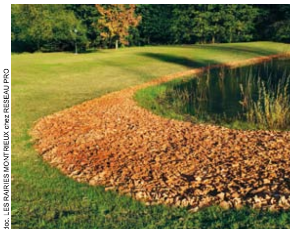
doc. LES RAIRES MONTRIEUX chez RESEAU PRO