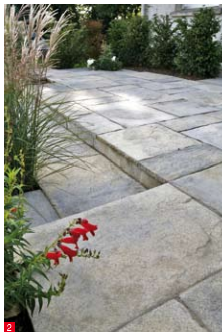
doc. STRADAL chez RESEAU PRO