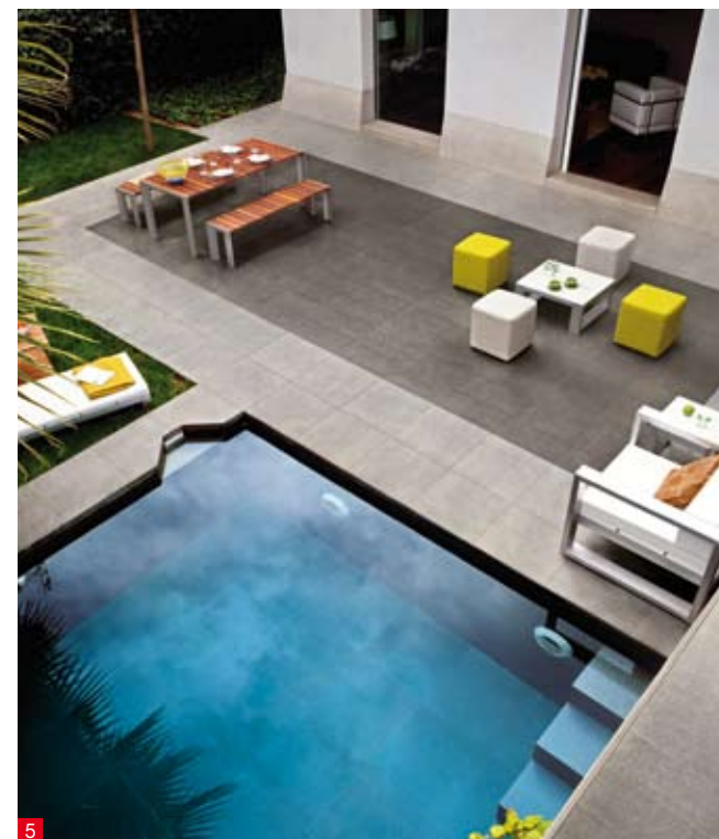
doc. LEA chez RESEAU PRO