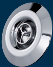
● Buse rotative