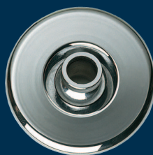
● Buse eau

Pour toute information complémentaire, s'adresser à :