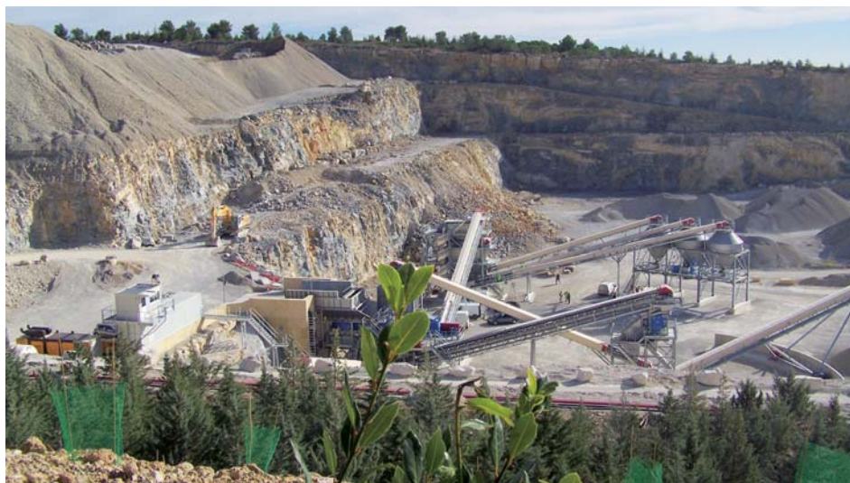
◀ En intégrant totalement ses installations dans la partie encaissée de la carrière de Castries, GSM réduit l'impact sonore et visuel de ses activités.

Outre la conception de l'outil industriel et la mise en place de ces dispositifs, la prise en compte de l'environnement pour la carrière GSM de Castries s'avère une préoccupation de tous les jours. À l'issue de sa rénovation, en 2007, Castries fut le premier site du secteur Languedoc à obtenir, après audit, le niveau 4 de la Charte Environnement des industries de Carrières de l'Unicem. Depuis 3 ans, les équipes GSM de Castries poursuivent leurs actions d'amélioration continue... des efforts récompensés aujourd'hui par le renouvellement de ce plus haut niveau de reconnaissance. Depuis, trois nouveaux sites ont suivi : Salon-Lançon de Provence (Bouches-du-Rhône), Bagard et Montfrin-Meynes (Gard).