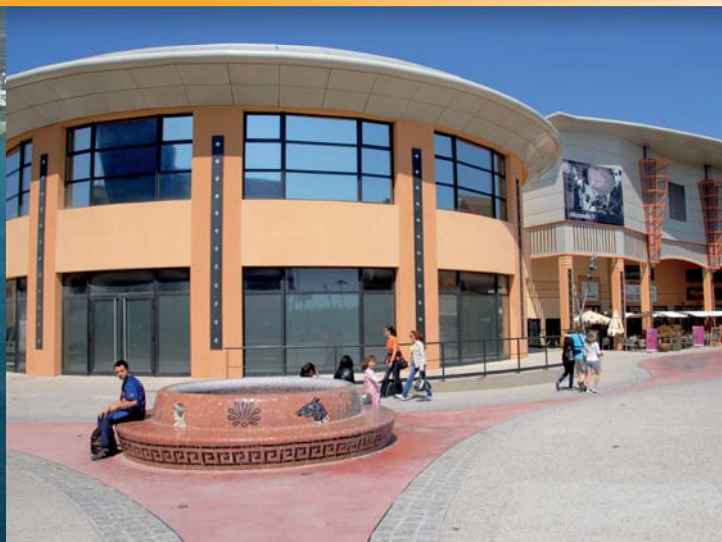
▲ Véritable acteur de la vie économique régionale, le site GSM de Castries participe à la réalisation de grands projets d'aménagement du territoire tels que ci-dessus les travaux de protection du littoral camarguais ou le centre commercial Odysseum de Montpellier.

Véritable acteur de la vie locale, le site GSM de Castries s'investit dans la politique dynamique de sa région. Accueillant sur son site un centre de stockage de déchets ultimes de la communauté d'agglomération de Montpellier, la concertation et la gestion commune des impacts sur l'environnement s'avèrent une responsabilité collective pour une parfaite intégration au territoire.