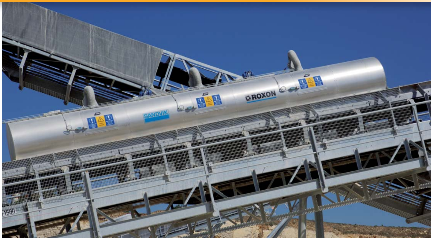
▲ Situé en sortie de concasseur secondaire, le système d'ionisation électrique abat les poussières.

Reflète de l'engagement de GSM en faveur de la maîtrise de ses impacts environnementaux, l'installation de Castries développe une démarche de performances techniques et de respect de l'environnement qui vise à l'inscrire durablement dans le tissu économique du département de l'Hérault. Ainsi, dès la conception du nouveau projet d'implantation, différents aspects ont été pris en compte : l'insertion paysagère, les émissions sonores et de poussières, la gestion de l'eau ou encore la sécurité du personnel.