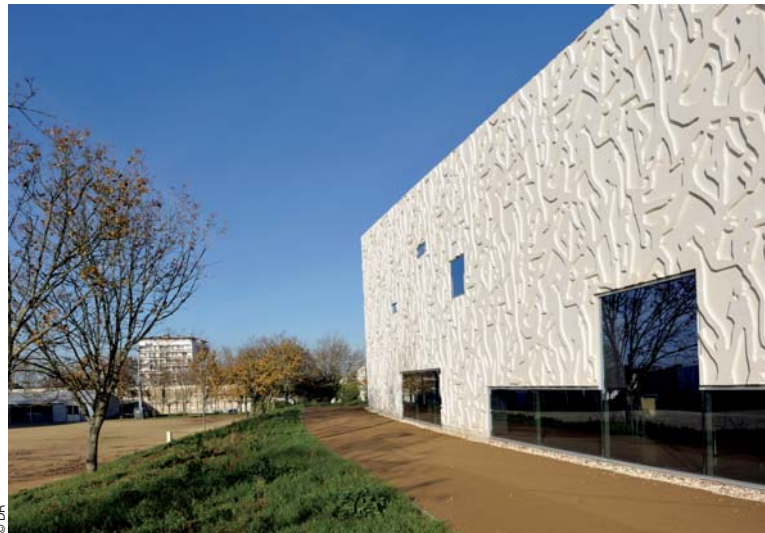
Cité de la Voile Éric Tabarly - Lorient (56).