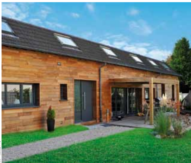
doc. Réseau Pro

Toujours porté par la volonté d'aller plus loin dans l'accompagnement du client et la préservation de l'environnement, la Division Bois et Matériaux de Wolseley France met en place un avantageux système d'Eco-primés.