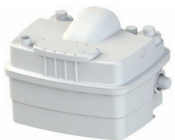
SANICUBIC® 2 Pro