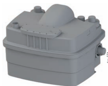
SANICUBIC® 2 Classic