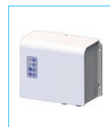
Boîtier électrique déporté

Les trois références SANICUBIC® ( SANICUBIC® 1 , SANICUBIC® 2 Classic et SANICUBIC® 2 Pro ) viennent d'évoluer et proposent désormais également des variantes qui se pilotent par un boîtier électrique déporté (câbles de connexion de 4 mètres fournis) et affichent une classification IP 68 . Le contrôle des appareils reste alors accessible et facile lorsque les appareils sont, par exemple, installés dans des puits.