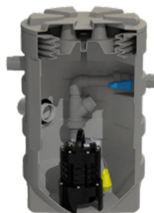
SANIFOS 280 VORTEX

Fabriquée en France dans l'usine SFA de Brégy (60), la SANIFOS 280 bénéficie ainsi du label Origine France Garantie.