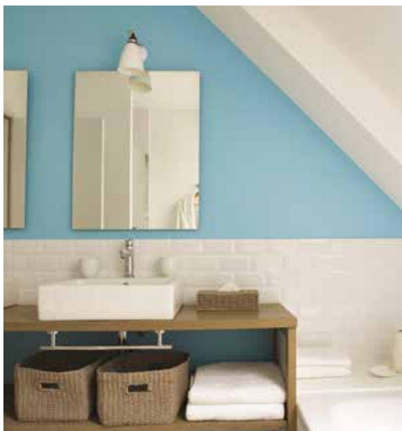
Pantex Satin CH2 0314 Bleu Osuni

Pantex Satin est également labellisée Ecolabel, avec 1 g/l de COV et une étiquette Qualité Air Intérieur A+, cette peinture répondra à tous les chantiers labellisés HQE®, LEED® ou BREEAM®.