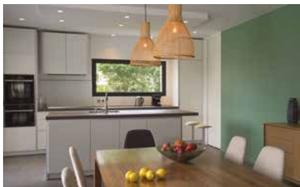
Doc. SEIGNEURIE® - Pantex Soie CH2 0753 Vert Sinsun

Autre atout, Pantex Soie annonce un taux de COV de seulement 3 g/l permettant également une utilisation dans les chambres d'enfants. Elle bénéficie d'ailleurs de l'Ecolabel et peut être utilisée pour les chantiers labellisés HQE®, LEED® ou encore BREEAM®. Enfin, recouvrable après 6 heures, la peinture Pantex Soie présente un rendement de 10 m 2 /litre.