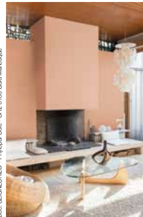
Doc. SEIGNEURIE® - Phylopur Soie - CH2 0180 Gold Manosque

Le confort d'application est également au rendez-vous de cette innovation. SEIGNEURIE® a veillé à faire de Phylopur une peinture biosourcée à la glisse parfaite, avec un film au long temps ouvert, pour un chantier garanti sans reprise. La peinture Phylopur peut s'appliquer à la brosse, au rouleau polyamide texturé 12 mm ou au pistolet, avec des rendements de 8 à 11 m 2 /l selon le produit : Impression, finitions Mat ou Soie. Le film est redoublable en 8 heures pour la finition Mat, 12 heures pour la finition Soie. De plus, l'offre Phylopur va permettre de répondre à tous les types de chantiers : pièces sèches comme humides, finitions Mate ou Soie, de l'impression à la finition.