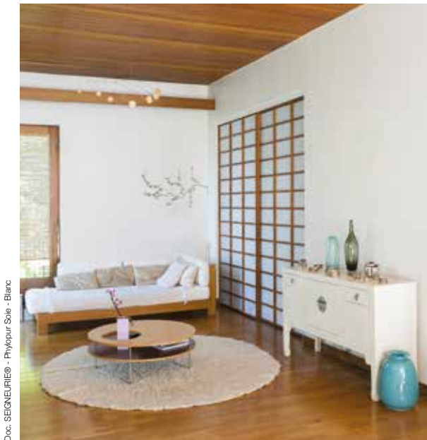
Doc. SEIGNEURIE® - Phylopur Soie - Blanc

Aujourd'hui, SEIGNEURIE® lance Phylopur , une peinture à base d'alkyde d'origine végétale en phase aqueuse. Cette peinture biosourcée va permettre à ses clients de répondre à tous les chantiers environnementaux et de « bâtiments biosourcés ».