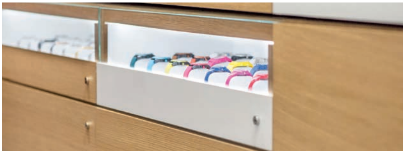
Vitrines - D018 Chêne de Meymac Espace sanitaire et cabines petite enfance - C062 Capucine et Signature Création

De manière générale, la protection Sanitized® augmente l'hygiène des surfaces par réduction des contaminations microbiennes. Concernant le segment Santé (établissements hospitaliers, salles blanches, laboratoires et Ehpad), complémentaire aux protocoles de nettoyage et de désinfection, elle contribue à la prévention des risques d'infections nosocomiales par contact avec des surfaces contaminées. Avec, en parallèle, une résistance aux produits désinfectants (type Anios, Clinimax ou Ecolab) et aux produits destinés aux soins (Bétadine®...).