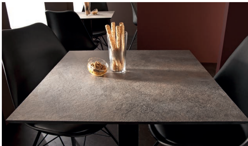
Tables de restaurant - C151 Caldeira

Enfin, soulignons que sans nanoparticules, les ions Ag+ intégrés dans le matériau ne sont pas solubles, ne migrent pas ni ne s'altèrent dans le temps. Par ailleurs, ils n'ont pas d'effet allergène, ni respiratoire, et ne présentent aucun risque pour l'Homme et pour l'Environnement. En effet, le traitement Sanitized® contient un produit biocide avec substance active : le verre de phosphate, non concerné par les restrictions REACH, Polyrey veillant à ce que ses fournisseurs n'utilisent aucune substance dangereuse.