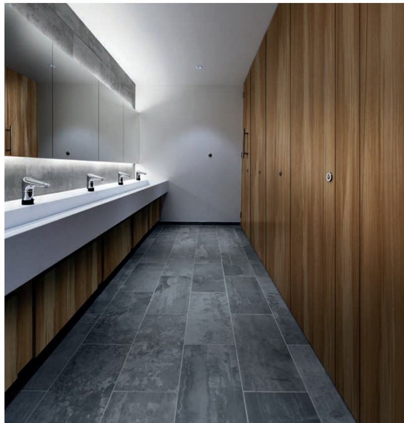
Cabines toute hauteur - N056 Noisetier Naturel