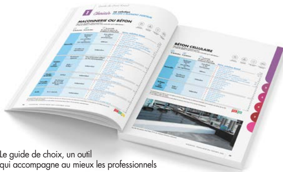
Le guide de choix, un outil qui accompagne au mieux les professionnels

www.knauf.fr/documentation/demande-de-catalogue