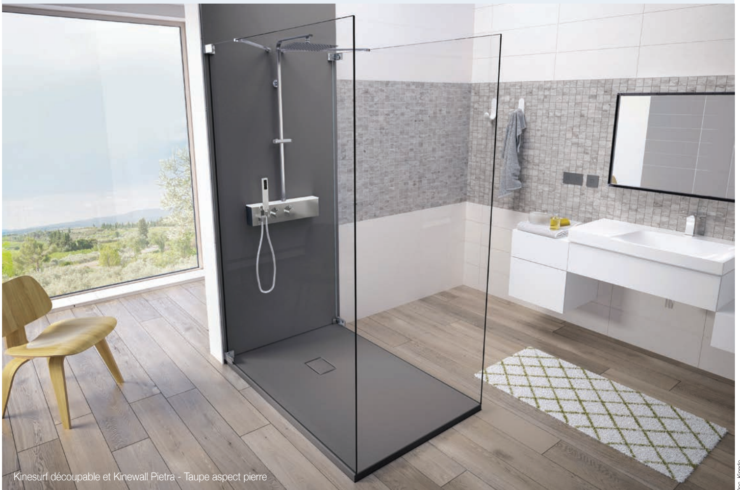
Kinesurf découpable et Kinewall Pietra - Taupe aspect pierre

Aujourd'hui, Kinedo clarifie son offre Kinesurf pour répondre encore plus précisément aux besoins du marché et propose deux déclinaisons : Kinesurf (en blanc brillant et non découpable) et Kinesurf découpable (grand choix esthétique avec diverses textures : pierre avec 5 couleurs au choix, mat grainé 6 couleurs et lisse en blanc brillant).