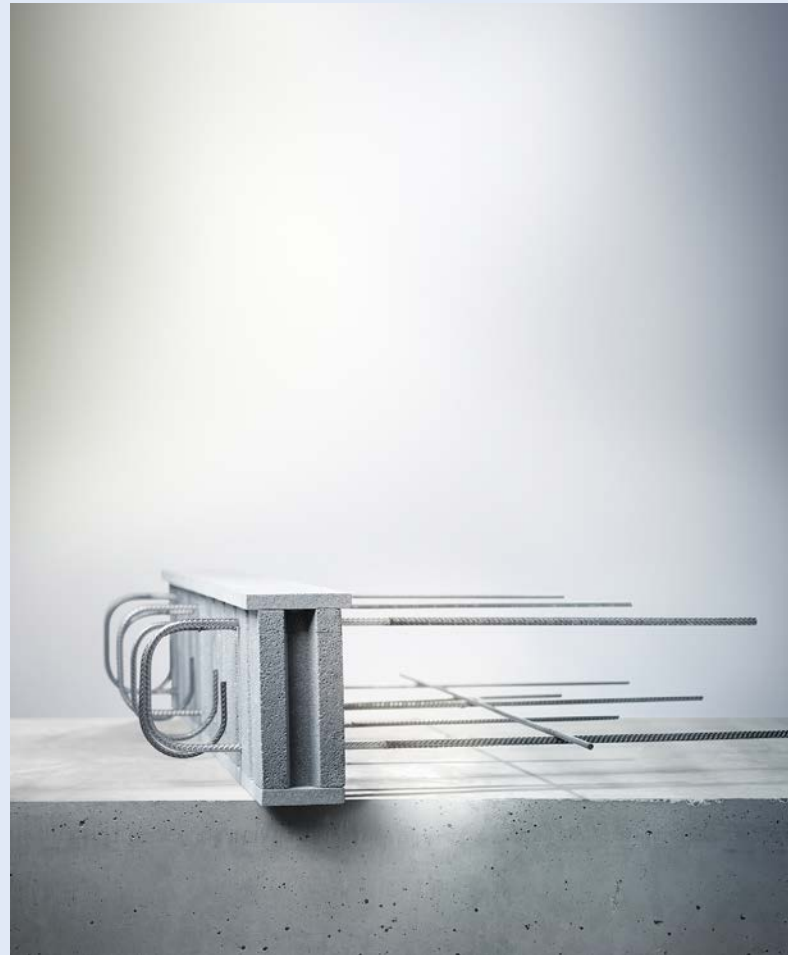
Schöck Rutherma® DFj

Au-delà de développer des solutions techniques toujours plus performantes, cette nouvelle FDES montre à quel point Schöck prend véritablement soin d'accompagner au mieux ses clients dans leur quotidien et confirme sa contribution pour une construction de qualité et bas carbone.