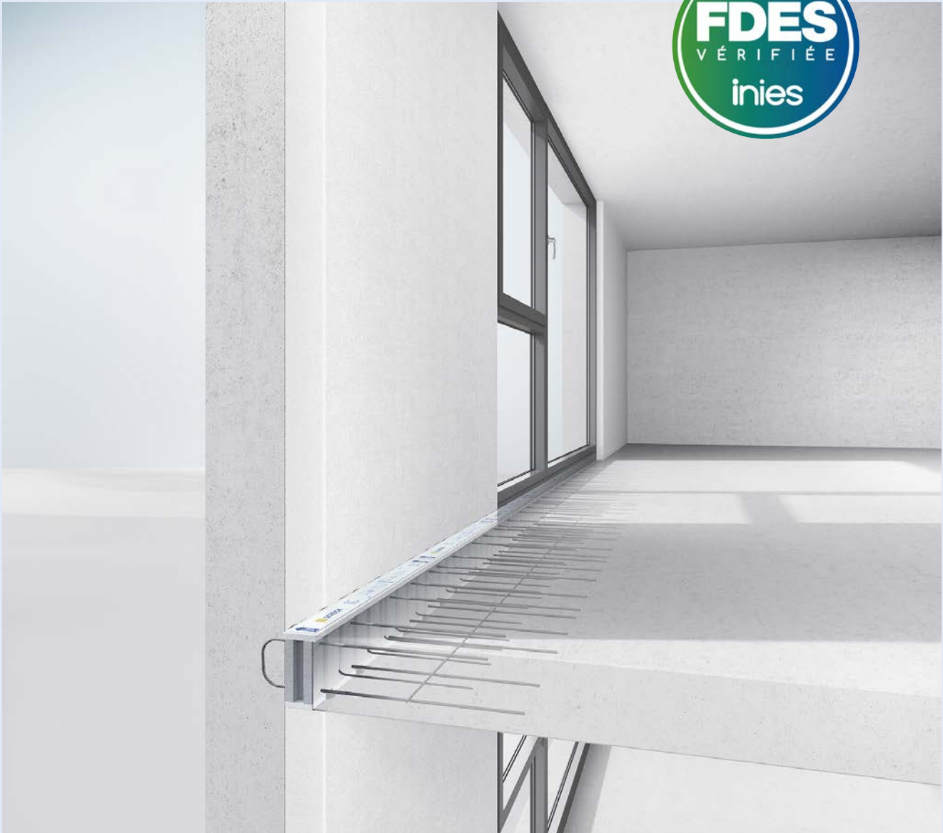
Schöck Rotherma ® DF i

Il y a 3 ans déjà, Schöck France se démarquait en étant le premier industriel à obtenir une FDES 1 pour ses rupteurs Rotherma ® type DF/ DF-VM. En ITI, éléments de jonction entre la dalle intérieure et la façade (la variante VM autorisant une mise en œuvre dans le cas de voile mince), ils permettent de réduire jusqu'à 85 % des déperditions énergétiques générées par les ponts thermiques. Cette FDES inaugurale (valable jusqu'au 1 er janvier 2024) se complète aujourd'hui d'une seconde. Celle-ci s'étend à l'ensemble de la gamme Rotherma ® en isolation thermique par l'intérieure, dont la dernière innovation DF i , poids plume en carbone. Les donneurs d'ordre, prescripteurs et thermiciens, peuvent dès lors atteindre plus facilement les performances en matière de poids carbone de leurs projets constructifs.