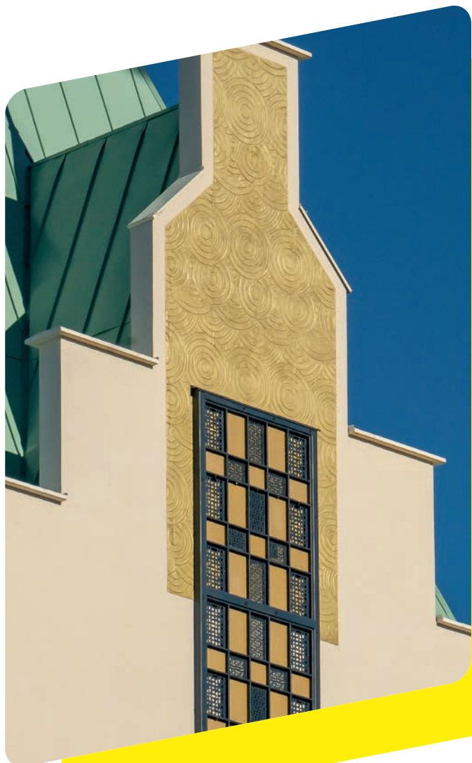
doc. Weber