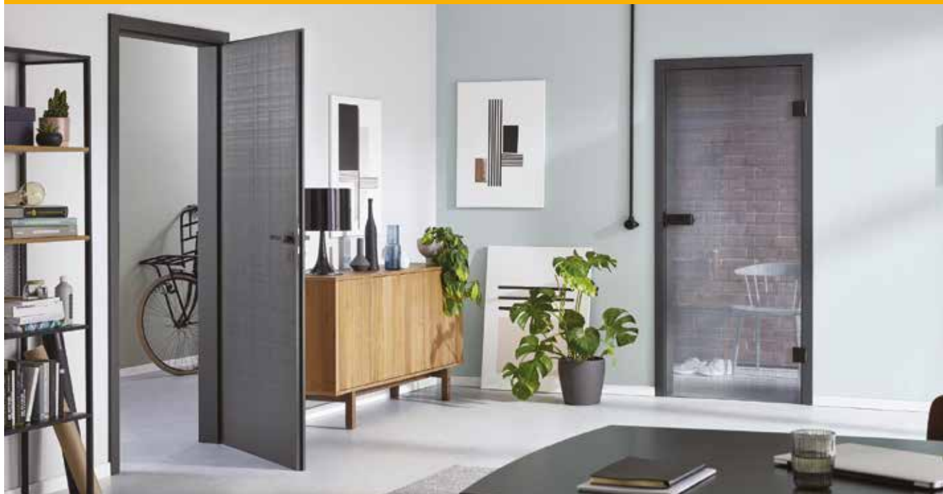
Hörmann propose une large gamme de portes d'intérieur neutres en carbone.