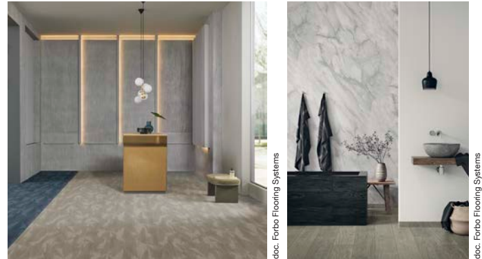
A gauche : Flotex advance latitude linen et latitude tempest A droite : Sarlibain - Sol : Surestep wood grey oak. Mur : Onyx+ marble white et Onyx+ uni ivory

Le textile floqué Flotex next , ensuite, rejoint la famille des solutions en pose 100 % libre , dont Forbo Flooring s'avère leader. En effet, grâce à l'usage de la bande de jonction Modul'up, Flotex bénéficie désormais d'une pose non collée, facile, rapide et économique . A la clé, une réduction des coûts de mise en œuvre et du temps d'immobilisation des locaux 1 , tout en préservant les performances de résistance, durabilité et confort qui font la réputation de la gamme Flotex.