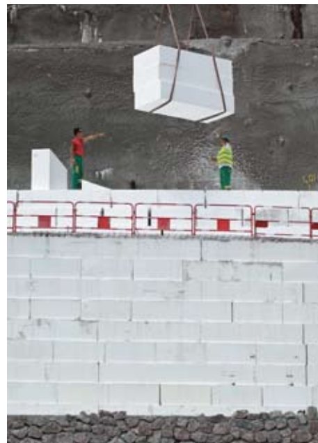
Près de 8.000 m 3 de polystyrène expansé, soit environ 2.500 blocs, ont été utilisés pour l'habillage des risbermes de la façade ouest et pour la réalisation des remblais.

Les quatre risbermes de la façade ouest, à la sortie du tunnel, ont été habillées par près de 4.500 m 3 de polystyrène , soit 1.400 blocs découpés et collés selon le calepinage défini par SCREG Sud Est .