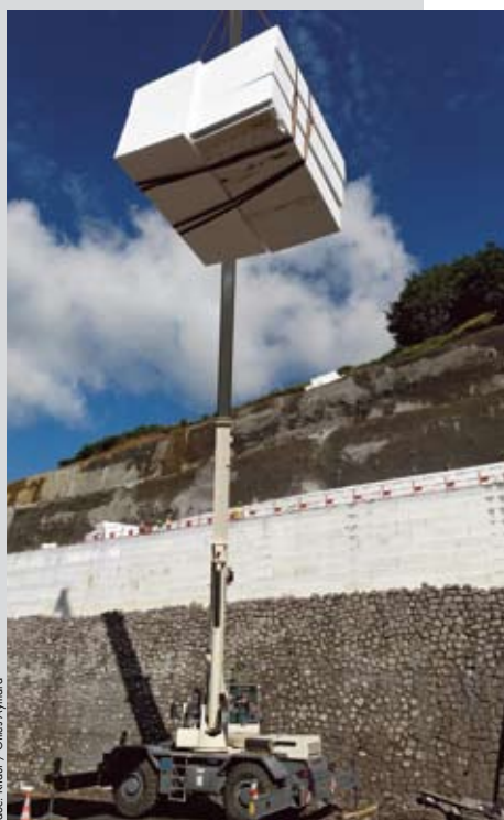
Le PSE, un matériau original et particulièrement léger qui n'est pas uniquement utilisé en tant que remblai routier ou d'aménagement.

Avec 20.000 collaborateurs, une implantation dans plus de 35 pays et près de 5 milliards d'euros de chiffre d'affaires, la force du Groupe Knauf se déploie dans le monde entier et ouvre un avenir prometteur en phase avec le développement durable et les impératifs économiques d'aujourd'hui. Le Groupe s'illustre comme le 1 er producteur européen de plaques de plâtre, le 3 ème producteur européen de laine minérale, le 1 er transformateur mondial de polystyrène expansé.